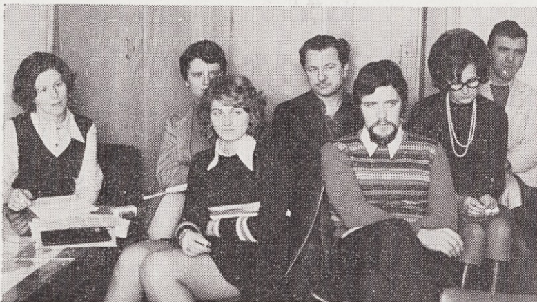
Letošnji odbor za informiranje

(navajajo, da predlog sporazuma o združitvi v 13. členu VI. poglavja predvideva, da bi o tem odločal odbor za program in razvoj podjetja). Zahtevajo, da o navedenih vprašanjih odloča odbor za medsebojna razmerja v SDS OSS, podobno kot to velja za ostale odbore o medsebojnih razmerjih v TOZD. Menijo, da je samo takšno določilo lahko usklajeno z intencijami nove ustave.