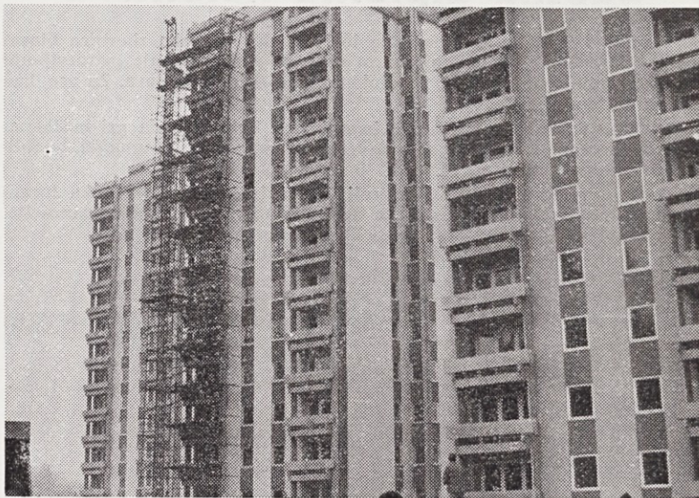
Stolpnice na Planini so skoraj nared za vselitev. Graditelji obljublajo, da meseca marca.

Če delavec izprazni stanovanje preje, kot mu poteče doba, za ka-