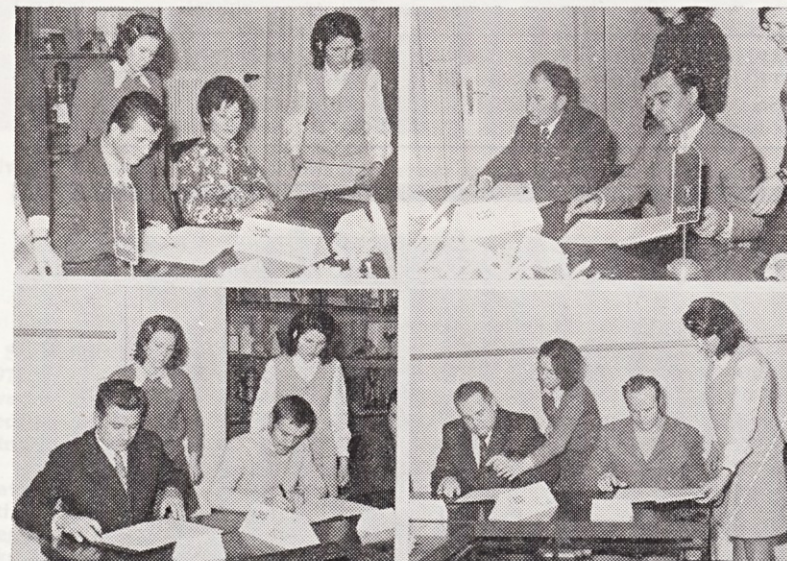
Samoupravni sporazum o združitvi temeljnih organizacij združenega dela so podpisali direktorji in predsedniki delavskih svetov temeljnih organizacij ter direktor in predsednik DS delovne organizacije.

Samoupravni sporazum o medsebojnih razmerjih je treba razumeti kot samostojni akt delavcev, ki se o teh razmerjih sporazumevajo. Kar