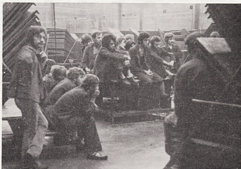
Člani delovne skupine konfekcije

Prav tako ugotavljamo, da so sprejeli predloge statuta TOZD z večino glasov vseh zaposlenih.