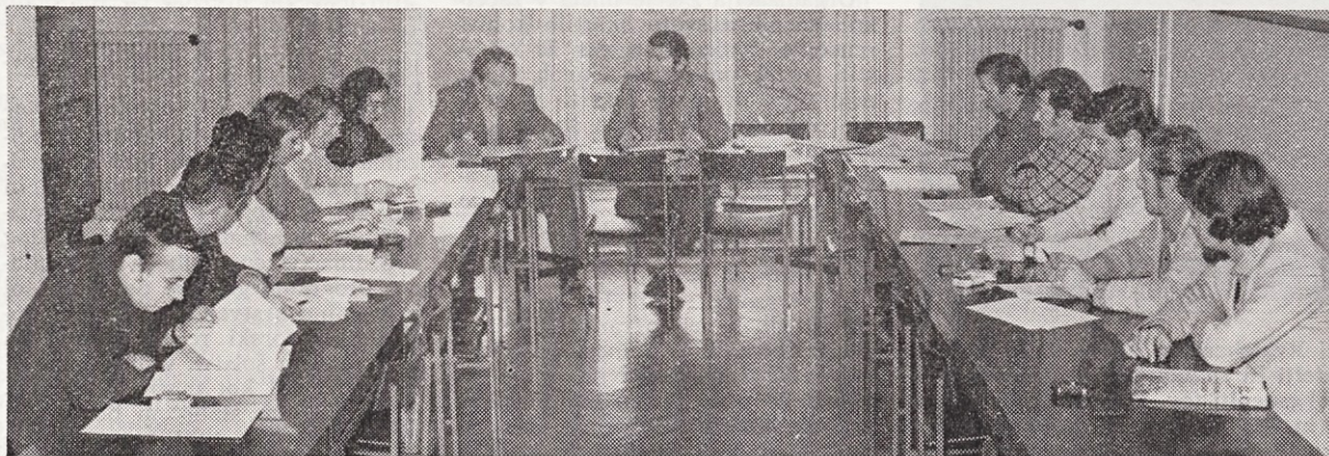
Člani izvršnega odbora konference sindikalne organizacije Sava redno razpravljajo o vseh važnejših družbeno-političnih akcijah v delovni organizaciji.