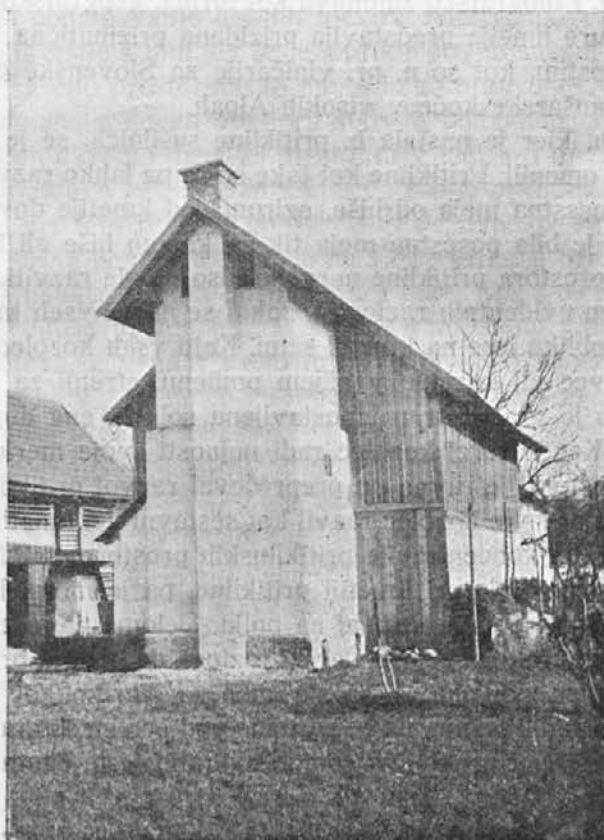
Slika 3. Glinje (Marinc).

pod njimi iz prizme pregibljive predale. V tem trodelnem gornjem delu sušilnice, ki je v celoti izključno samo zidana, se hmelj suši od toplote, ki se dviga od peči preko cevi v višino. Ako je torej hotel kmet praktično uporabiti tovarniško ali obrtniško sušilnico, jo je moral vzdati, oziroma postaviti v zidano prizmo, kar ravno znači v savinjskem pojmovanju sušilnico. To prizmo je prizidal kaki pritiklini (slika 3) ali pa hlevu, ker samostojno ozka, a visoka stavba ni mogla obstojati; h kozolcu pa radi opasnosti ognja sušilnice ni mogel postaviti, pa tudi radi tega ne, ker so v dobi razvoja sušilnic prehajali plašivci v kozolce v ožjem in pravem pomenu besede, tako da kozolec v dobi razvoja sušilnic še daleko ni splošen. V zvezi s postavitvijo sušilnice pa je moral kmet rešiti tudi vprašanje shranjevanja hmelja, tako da je reševal večinoma na en mah dva problema.