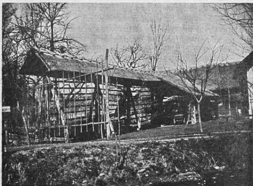
Slika 1. Rakovlje (Planka).

zolca deloma pri kmetiji, kjer je razvit kot plašivec, deloma pa zunaj na polju, kjer stoji kot lesa.