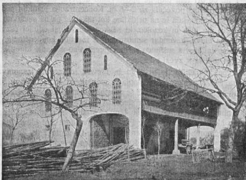
Slika 4, Kamenče (Gregl).

razvitega hleva (slika 4) in tvori ekvivalent prostoru med lesami in hlevovo podolžno steno pri še s slamo kritem hlevu v obrobnem hribovju. Razlika med obema obstoja bistveno v tem, da so v hribovju v lesah late in da niso lese zvezane po podu z nadhlevom kot takim, kakor pri novem poslopju v dolini, ki daje vsej prednji strani značaj hodnika. Značilna za novo blagostanje pa je zunanja impozantna, ponosna oblika poslopja, ki je v pritličju zidano iz kamnja, zgoraj pa iz opeke. Stene iz opeke karakterizirajo iz opeke izdelane in živo, a enotno barvane mreže; streha je redno pokrita z opeko. Ne glede na material in arhitektoniko in nje izvedbo, ki je različna, pa predstavlja hlev z velikim platom samô prestavitev hleva z lesami na solnčni podolžni strani iz hribovja v dolino. Kakor je terjala živinoreja v hribovju velike prostore in s tem ustvarila prostran širok hlev, je postavil iste zahteve v dolini hmelj ip ustvaril kot posledico isto, namreč hlev z velikim platom. S hlevom z velikim platom je oblikovna etnografska razlika med hlevom v hribovju in v dolini izginila, ostala je samo dekorativna raznolikost in raznolikost materiala. Geografsko pa je hribovje in dolina postala z istoličnim hlevom ena geografska enota; nekdanja fizijogeografsko in antropogeografsko utemeljena razlika je vsled kulture hmelja izginila, hribovje in dolina sta se po istem tipu hleva strnila tudi v etnografsko enoto.