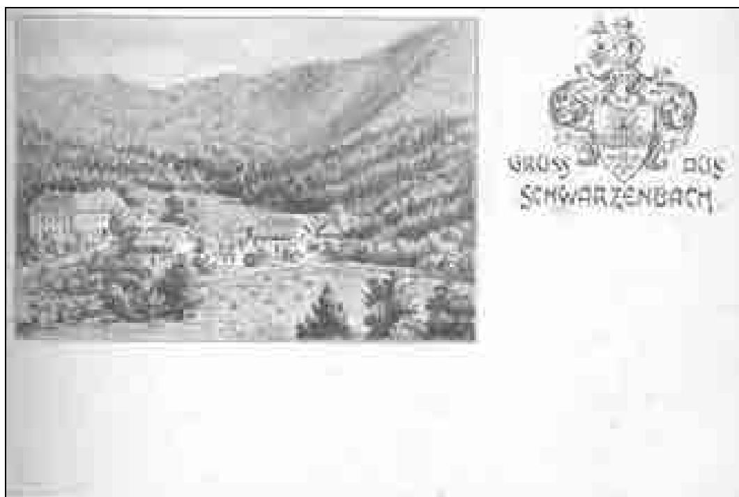
Črni Potok z grbom baronov Wurzbachov na razglednici, natisnjeni okoli leta 1905 (Brilej, Spomin na Litijo, str. 113).

The events took an unexpected turn during First World War, which took its toll at the very end. The Post Office Savings Bank went under and the girls lost their entire possessions. From then on they took their lives into their own hands.