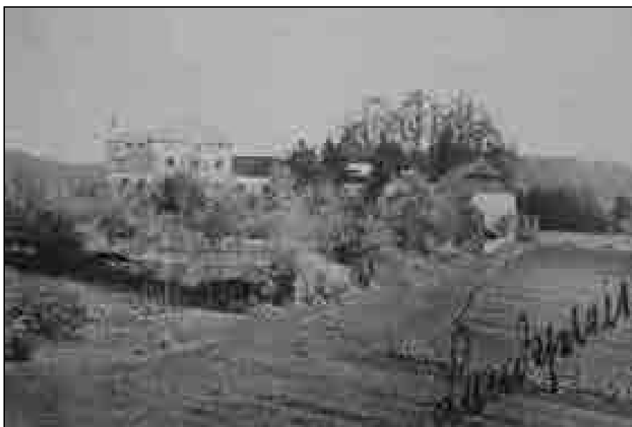
Grad Lanšprež leta 1920.