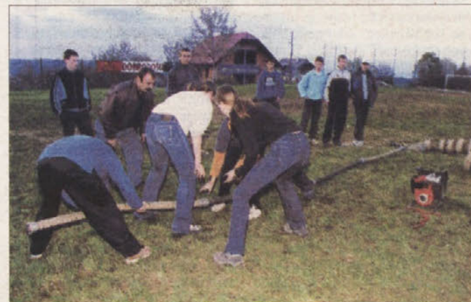
Mladi dolški gasilci so med najboljšimi v občini in v državi.

Pred dobrimi 150 leti je pod Dolžem začela obratovati steklarna - "glazuta". Tam so dobili zaposlitev prebivalci teh krajev. A uporni in za krivice občutljivi Podgorci, Trdinovi "stari demokrati", so tu leta 1851 organizirali prvi znani štrajk na slovenskem ozemlju, 1854 pa je glazuta že ugasnila svoje peč. Kasneje so Podgorci dobili delo v "fabriki" na Gorjancih, kjer je bilo v nekem obdobju več delovnih mest kot v Novem mestu. Danes je iz krajevne skupnosti zaposlenih več kot 150 ljudi, od tega jih ima delo v domačem kraju le kakih 20, ostali pa se vozijo drugam, največ seveda v Novo mesto.