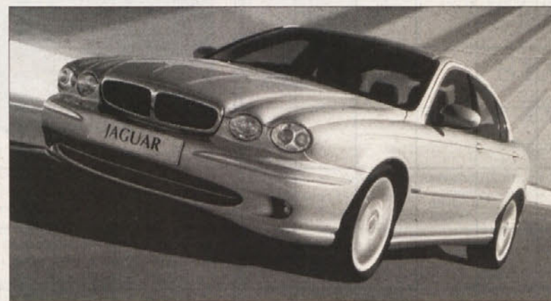
Slika 3: X-type je prvi jaguar, ki je cenejši od 10 milijonov tolarjev.