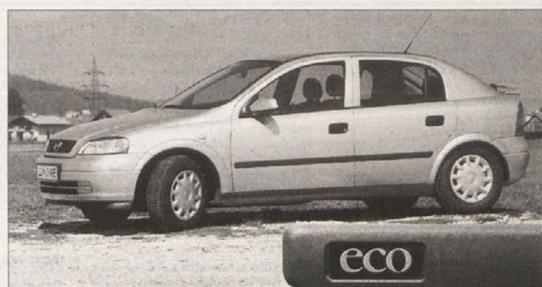
Z astro eco 4 Opel postavlja varčevalne zakone.