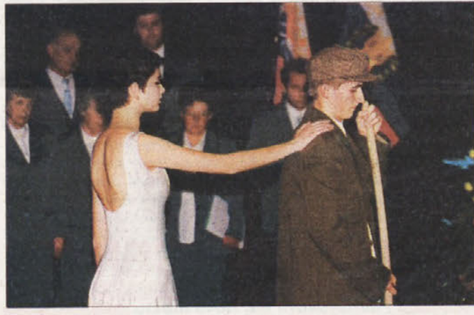
NASTOP GIMNAZIJEV - Skorajda polno dvorano novomeškega Kulturnega centra Janeza Trdine so na proslavi v počastitev dneva upora in ob 60-letnici ustanovitve OF zelo navdušili mladi novomeški gimnazijci, ki so skozi recitale povedali, kakšen je njihov odnos do teh pomembnih dogodkov v slovenski zgodovini.

NOVO MESTO - Elektrotehniško društvo Dolenjske vabi na predavanje o malih hidroelektrarnah, na katerem bo strokovnjak s tega področja Marko Gospodjinački iz Zveze društev malih HE govoril o procesu postavitve male elektrarne od ideje do uresnitve. Predavanje bo v sredo, 16. maja, ob 12. uri v prostorih PE Elektro Novo mesto. Kotizacija je 6.000 in za člane društva 4.000 SIT, prijave pa zbirajo do 11. maja.