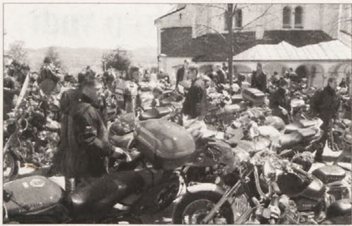
ODPRLI MOTORISTIČNO SEZONO - Med številnimi prireditvami, ki so minuli petek potekale na širšem ribniško-kočevskem območju, je bila prireditev, ki jo je organiziral Motoristični klub Ribnčan, nedvomno med večjimi. Ze tretje leto zapored so pri Novi Stifiti organizirali blagoslovitev motorjev, motoristk in motoristov, s čimer pa so tudi uradno odprli letošnjo motoristično sezono. Tako kot so pričakovali, se je prireditev udeležilo okoli 500 motoristov iz vse Slovenije in tudi tujine.