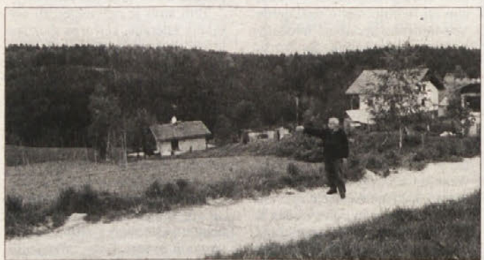
NOVA POT NAJ BI ŠLA PREKO NJIV - Tako je pokazal Drago Brajdič: in dejal: “Ne razumem, zakaj občina ne odkupi teh metrov zemlje za novo romsko pot.”