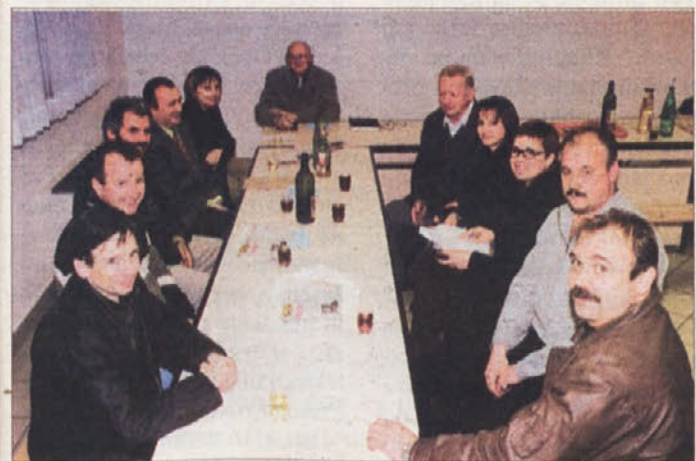
Uredništvo v gosteh pri prijaznih dolških gostiteljih v lepi dvorani tamkajšnjega gasilskega doma, ki je središče družabnega življenja v tem delu Podgorja.

Za konec pa še nekaj o "zarukanih" Podgorcih. V krajevni skupnosti Dolž sta dve postaji novomeške potujoče knjižnice, na največjim obiskom in izposoji knjig na številno gospodinjstev. Na Zajčjem Vrhu pa imajo toliko izkaznic knjižnice, kot je gospodinjstev. To je tako, kot bi v Ljubljani iz vsake hiše in stanovanja hodili v Narodno in univerzitetno knjižnico. Pač ne more biti vsak Podgorci!