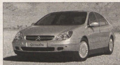
Citroën z novim modelom C5 obrača list v svoji zgodovini.

S picasojem, obnovljeno xsaro in sedaj še s povsem novim C5 se Citroën prebija v vrh evropskih proizvajalcev. Vse skupaj potrjujejo tudi številke, ki kažejo rast prodaje, C5 pa jih lahko le še okrepi. Jeseni na našem tržišču lahko pričakujemo še karavansko različico.