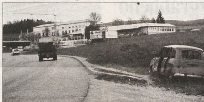
KAR OB CESTI - Pomladanske ekološke akcije so že skorajda mimo, toda vseeno je še marsikje mogoče najti črna odlagališča odpadkov pa tudi odslužene avtomobile. Tale stara katrca že nekaj časa stoji ob glavni cesti Bršljin-Mirna Peč in, neverjetno celo bližnji Romi je ne odpeljejo za prodajo starega železja.

DOLENJE PRAPREČE - 19-letni U. K. iz okolice Grosuplja je utemeljeno osumljen poškodovanja ali uničenja javnih naprav, ker je 29. aprila popoldne z delovnim strojem opravil izkop za izgradnjo gospodarskega poslojpa in pri tem poškodoval telekomunikacijski kabel za povezavo mednarodnega omrežja. Zato izpla celotna telefonska poštna linija z mobilno telefonijo in internetne storitve. Nastala škoda znaša okrog milijon tolarjev.