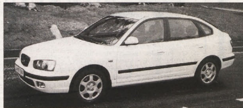
Ne glede na ime se elantra danes predstavlja v povsem novih oblekah.

Lantra je pri nas našla kar precej ljubiteljev, lahko trdimo, da bo tudi nova elantra enako priljubljena. Žal ni na voljo karavana, ki je pri nas požel velik uspeh. Tega sedaj zamenjuje peterovratna različica, ki je z dvolitrskim motorjem in paketom opreme GLS, kakršno smo preizkusili tudi mi, na voljo za 3,2 milijona tolarjev.