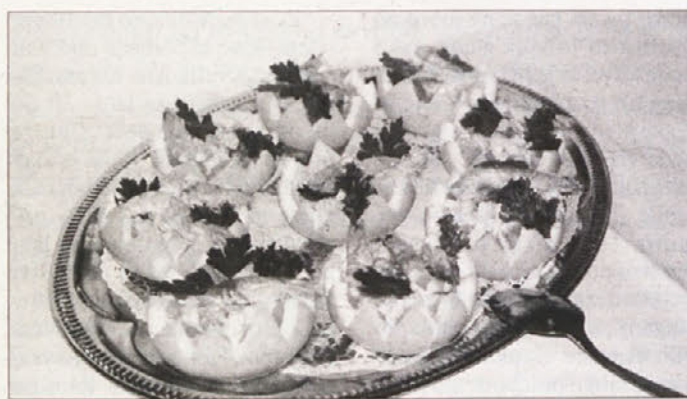
DIETNO - Hran aza vitek stas