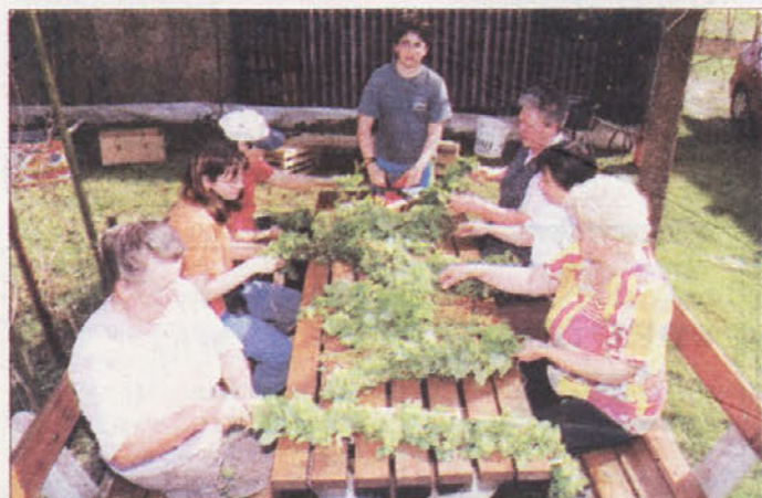
PRAZNIČNO V GOTNI VASI - 1. maj, mednarodni praznik dela, po vsej državi že tradicionalno praznujemo s prižigom kresa in postavitvijo mlaja. Tako tudi v novomeškem naselju Gotna vas pod vodstvom tamkajšnjega Kulturno-športnega društva postavljajo mlaj in na predvečer praznika prižigajo kres na "Barončevem hribu" nad naseljem. Letos so krajani že četrto zapored zavijali rokave, da krajevna tradicija ne bi utonila v pozabo. Do končne podobice mlaja je kar nekaj dela. Moški pripravijo smreko, mlajši pa naberejo lipce, ki jo nato izkrene krajanke spletoje v kite (na sliki), s katerimi okrasijo smrekico na vrhu mlaja.