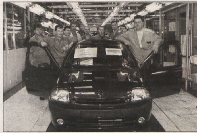
ZADNJI NOVOMEŠKI CLIO II - V novomeški tovarni Revoz so se 20. aprila poslovili od zadnjega clia druge generacije, ki so ga izdelovali vse od leta 1998. V teh letih je z montažnih trakov v Novem mestu odpeljalo kar 356 077 primerkov tega priljubljenega avtomobila, skupaj pa je bilo v vseh Renaultovih tovarnah, ki proizvajajo ta model, izdelanih 1 milijon 850 546 cliov II. Bil je prodajna uspešnica tako v Sloveniji, saj je bil najbolje prodajani avto v svojem razredu, kot tudi v Evropi, kjer je bil med prvimi tremi. Clio II je že nasledil "novi clio", katerega so svetu premierno predstavili na 22. mednarodnem avtomobilskem salonu v Ljubljani.