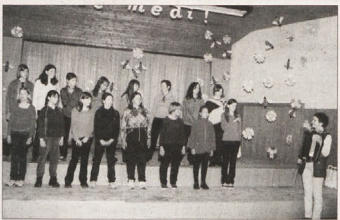
ČEBELAM IN ČEBELARJEM - Tekmovanje mladih čebelarjev Posavja na OŠ Maksa Pletersnika v Pišecah se je začelo s kulturnim programom, nastopajoči v njem so tudi na fotografiji. Izvenel je kot lep poklon čebelarstvu in tako prava vzpodbuda ekipam, ki so potem odšle na tekmovanje, ter drugim udeležencem, ki so odšli na okroglo mizo.