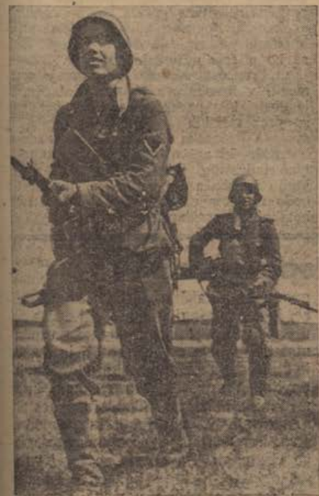
PK-Aufn.: Kriegsbericht Hermann (Wb.).

Italijanska Severna Afrika meji ob Sredozemsko morje in ob Egipt, kar predstavlja jabolko razdora med italijanskimi in britanskimi interesi. Velika Britanija ima v Egiptu, ki je do neke meje samostojna država, svoje vojaške pozicije, ki ji naj pomagajo držati in obvladati njeno morskó cesto po Sredozemskem morju, ki je najbližja morská pot v Indijo. Ni čudá, da so se v sedanji vojni boji za Kirenajko vodili že, v takih obsegih, da je