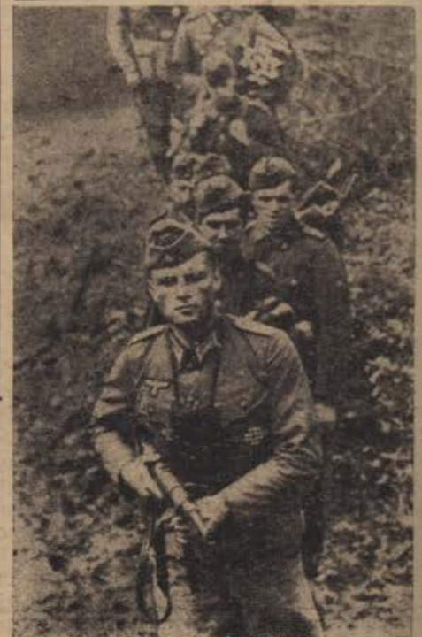
Kriegsbericht Schambortzky (Wb.). Einsatz eines Pionier- und Minenzuges.