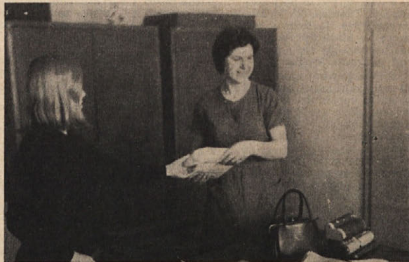
Tudi za letošnji praznik žena nas je presenetila s praktičnimi darili sindikalna organizacija

Odobreni sta bili dve službeni potovanja: vodji tehničnega sektorja za potovanje v Anglijo zaradi proučitve možnosti nabave dela nove opreme za predilnico, vodji EE oplemenitilnica pa za potovanje v ZR Nemčijo zaradi proučitve uporabnosti novih kemikalij in postopkov v EE oplemenitilnica.