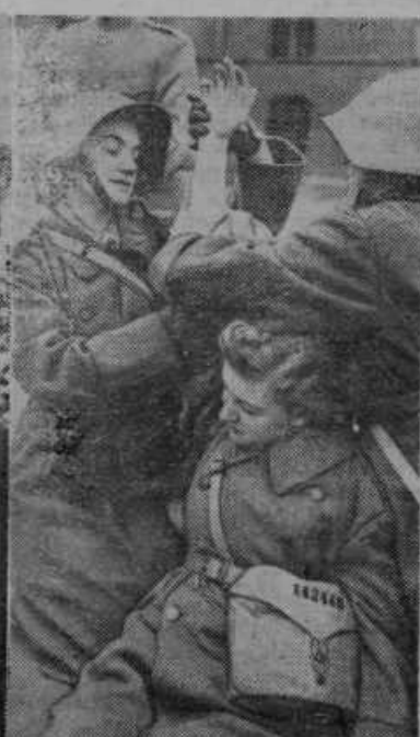
V nemško armado so uvedli ženske sanitejke kot pomožne čete. Slika nam predstavlja tri sanitejke pri vezbanju

da so nesrečnemu bitju ohranili življenje. Deček je dobil rento, naučil se je krojaštva. — Regent Horthy mu je rento spet obnovil ter jo bo najmlajši invalid svetovne vojne dobival do kraja življenja.