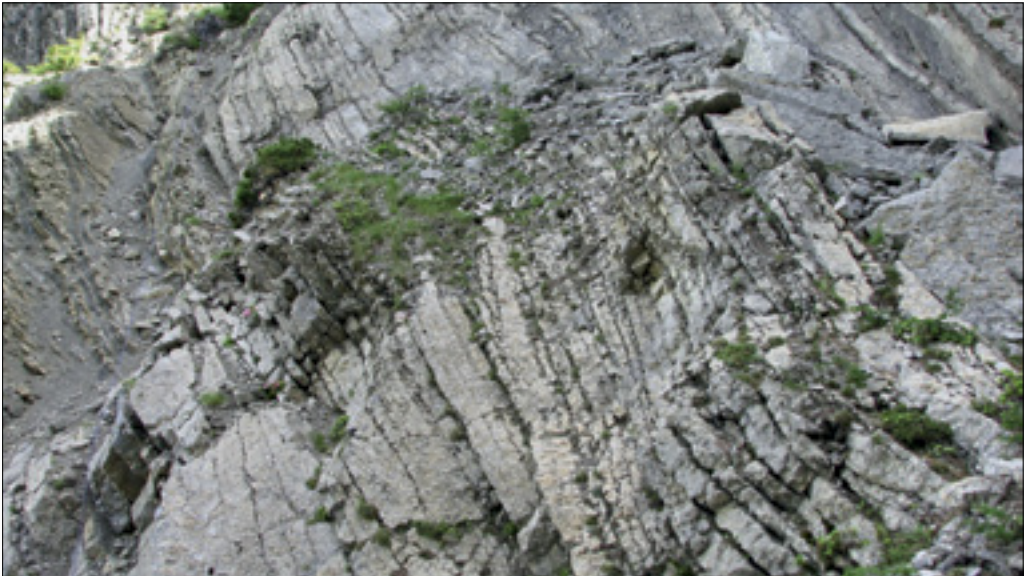
Izdanek apnencev tipa Pontebba na Križevniku. Outcrop of Pontebba limestones on Mt Križevnik.