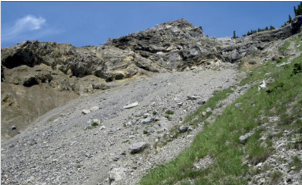
Izdanki srednjetriasnih ladinjskih plasti pod starim mejnim prelazom Ljubelj. Outcrops of the Middle Triassic Ladinian beds below the old Ljubelj border crossing.