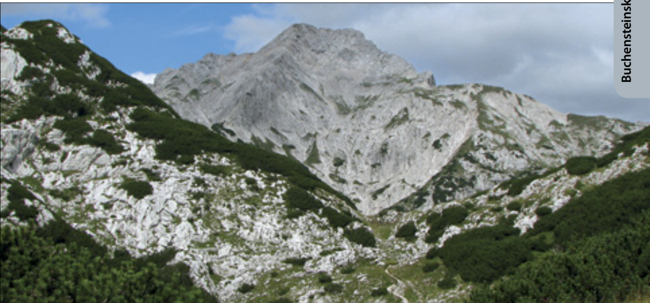
Schlernski apnenci gradijo ostenja Ojstrice. Schlern limestones build massifs of Mt Ojstrice.

Proti jugozahodu se plasti nadaljujejo po policalah proti Križevniku.