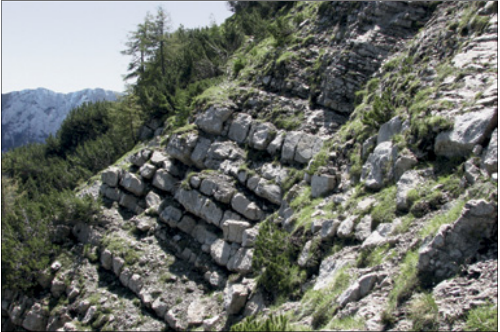
Izdanek plasti Buchensteinske formacije na Utah. Outcrop of the Buchenstein Formation on Mt Ute.