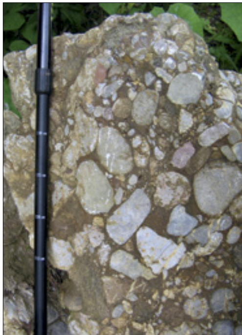
Izdanek ukovške breče v Dovžanovi soteski.

Zaradi diferenciranega premikanja so bili nekateri bloki Julijske karbonatne platforme dvignjeni nad morsko gladino in izpostavljeni subaerskemu preperevanju in zakrasevanju, kar je povzročilo erozijo starejših kamnin in njihovo odnašanje v nižje ležeče depresije. V teh depresijah so se odlagale raznovrstne breče (Ukovške breče), gramozovci