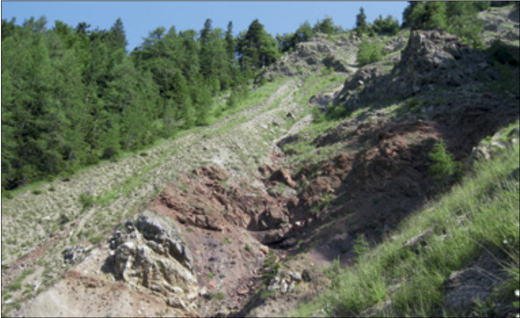
Plasti Ljubeljske formacije med Ljubeljem in Košutico. Beds of the Ljubelj Formation in the area between Ljubelj and Košutica.