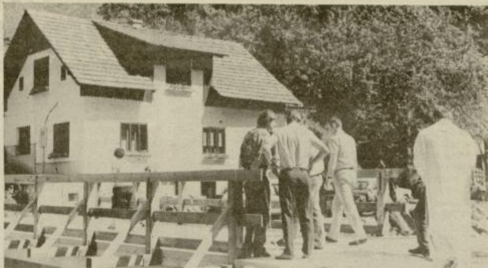
Bregarjev most čez potok Krumpah, ki omogoča družini Pečnikovih stik s svetom. Na dan otvoritve so prvi po njem zakorakali domači, ki so se ga tudi najbolj veselili.

Preteklost celjskega gleda- lišča pa je na razstavi ujeta skoz dokumentarno gradivo o uprizoritvah dram o Celj- skih grofih, ki jih ni bilo ma- lo. Razstava je vsekakor vredna ogleda in pozornosti. MP