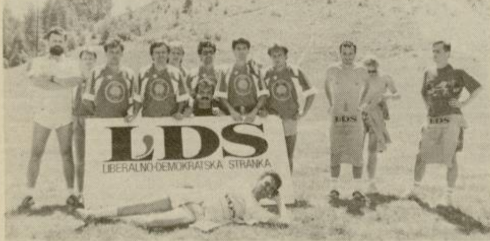
Edini, ki so se bili po končanem parlamentarnem turnirju v malem nogometu na celjskem Gričku pripravljene fotografirati pred panojem LDS (sicer organizator srečanja), so bili zmagovalci - ekipa Zelenih. Ob njih vidimo še nekaj na pol golih, utrujenih in izmučenih liberalnih-demokratov.