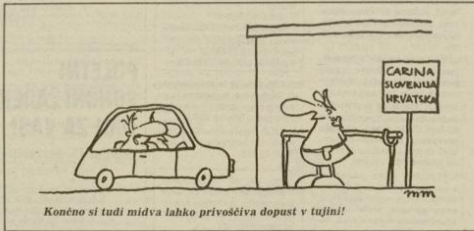
Končno si tudi midva lahko privoščiva dopust v tujini!