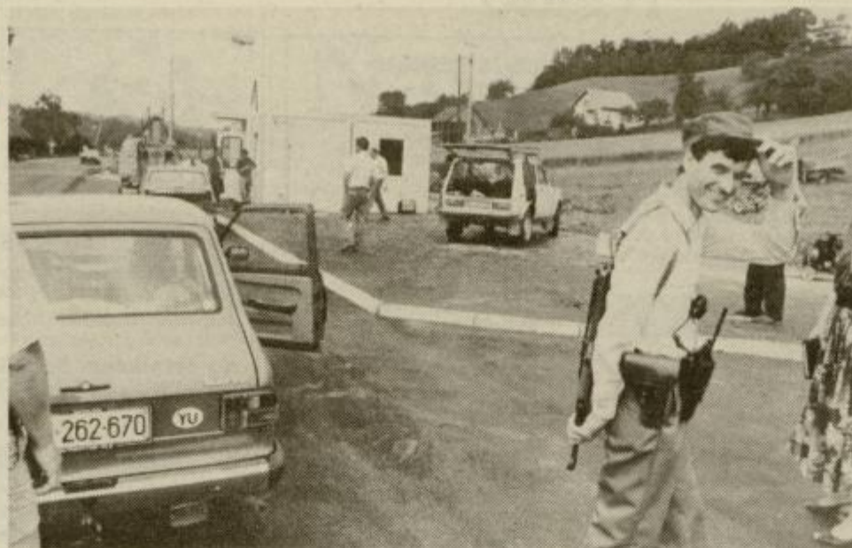
V torek dopoldne je bila mejna kontrolna točka v Dobovcu še živahno delovišče. Zvečer je moralo biti vse nared.