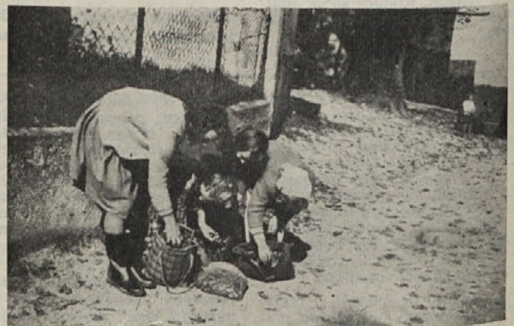
Kostanj je bilo v letu zelo lepo obrodilo. Kar pogledajte »kostanjarije« od Sv. Gregorja, kako veselo se sklanjajo nad polnimi posodami. Le časa je premalo za nabiranje. Solske dolžnosti in delo na polju neizprosno kličeeta...

Za prihodnje leto predvidevajo gospodarske organizacije, da bo z ozirom na letošnjo oceno znašal njihov celotni dohodek za 10,3 % več kot letos, narodni dohodek za 13,5 % več, zaposlenih bo za 1,6 % več, medtem ko naj bi znašal izvoz kar za 47,1 % več. Svet je gospodarskim organizacijam priporočil, naj plane ponovno prouče in naj temelje na izkušnjah letošnjega in lanskega leta, naj povečujejo proizvodnjo artiklov, ki jih je moč plasirati na domačem in tujem trgu, naj pri porastu produktivnosti upoštevajo uvedbo 42-urnega delovnega tedna, naj realneje planirajo investicije (predvsem njihove vire) in da naj za gospodarske investicije združujejo sredstva.