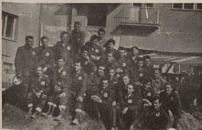
»Zidarjevi« zidarji v Skopju