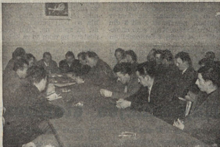
Z ustanovnega občnega zbora sindikata industrije in rudarstva

Po ogledu Ribnice so se italijanski gostje odpeljali proti Kočevju.