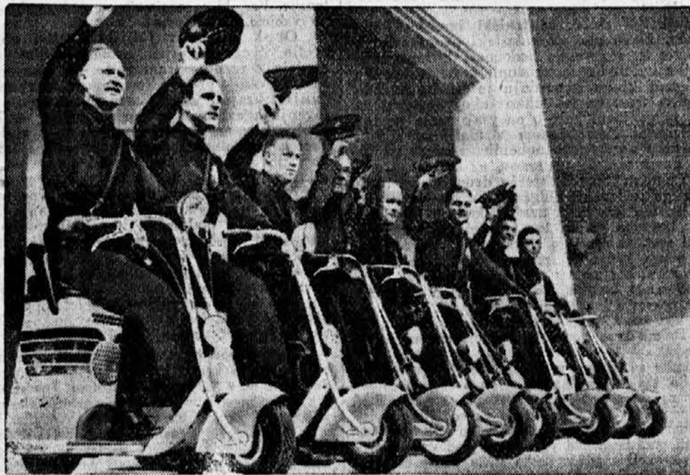
Taka smešna otročja vozila je dobila policija po nekaterih kalifornijskih mestih. Kljub okornosti dosežejo ti biciklji brzine 60 do 70 km na uro.

»Gospodje, kaj pa vendar mislite z vašim krohotanjem, saj boste vse ostale kolege zbudili, ki so nekoliko zadremali.«