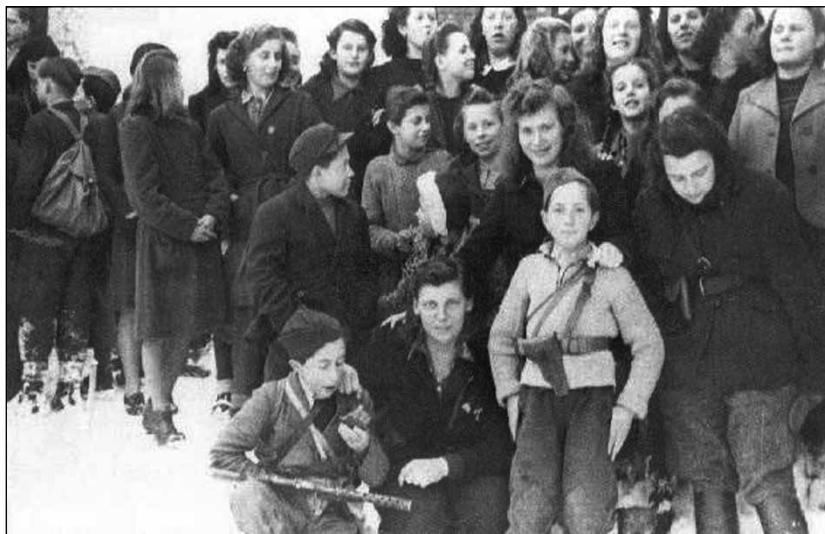
Mladinska konferenca članov selškega okraja na Zalem Logu, pozimi leta 1945.

ki so jih hoteli izseliti, so izpustili. Ostale so osvobodili zavezniki ali partizanske enote. Iz tujine so se začele vračati izseljene družine in sestradani ujetniki, ki so preživeli mučenja taborišč. Poraz okupatorja se je bližal hitreje, kot so terenski aktivisti OF pričakovali, vendar pa se je okupator dokončno vdal šele takrat, ko je do kraja izčrpal svoje bojne moči. 8. in 15. aprila je okupatorjeva vojska na Koroško odpeljala najprej žene in otroke pri naseljenih nemških nameščencev, 24. aprila pa so odredili tudi odhod ostalih nemških uradnikov. Umik nemških sil je bil močno oviran, zato so se umikali večinoma ponoči, čez dan pa so se skrivali v gozdovih. Na naloge ob odhodu okupatorja so se pripravljali tudi NOS, POS in protifašistična organizacija z Narodno zaščito. Gorenjsko vojno področje je bilo zadolženo, da ob odhodu okupatorja vzpostavi red ter mobilizira za boj sposobne moške. Zagotoviti so morali varnost prebivalstva, prometa in javnih zgradb. Ukinili so vse okupatorjeve ustanove in organizacije in poskrbeli za ohranitev njihovih spisov in inventarja. V tovarnah so nadaljevali z delom, banke in trgovine pa so morale ostati zaprte, razen za nakup najnujnejših potrebščin. Odprte so morale ostati tudi pekarnice, mlekarnice, mesarije, bolnišnice, pošta, telefon in javne kuhinje. Prebivalci so bili dolžni oddati vso vojaško opremo.