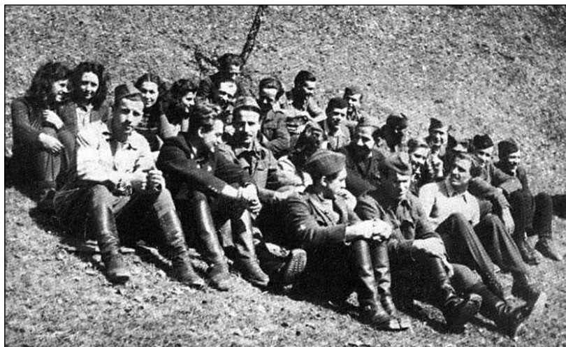
Sestanek tehnikov in tiskarjev z Gorenjske v Davči marca 1945.

Aprila 1944 je bil zgrajen bivak za novo selško tehniko na zemljišču v Megušnici v Martinj Vrhu. Tudi v šolskem posloplju v Martinj Vrhu in kasneje v skritem bivaku pod njim je od januarja 1944 delovala tehnika Gorenjskega odreda. V severni del Selške doline so prinašali partizanski tisk iz jelovške tehnike, ki je delovala v gozdu med Jamnikom, Rovtami in Podnartom. Kasneje so jo odkrili domobranci, delavci pa so se po skritem prehodu umaknili. Prav tako so nad Podlonkom maja 1944 zgradili mladinsko tehniko "Murko", ki so jo sredi avgusta opustili. Nad Rudnom je bila v Rudenski grapi v jeseni 1944 v bivaku zasnovana tehnika Drava. V Davčo pa so jeseni 1944 prepeljali tudi tiskarski stroj in opremo iz tiskarne Trilof, ki so ju najprej namestili v dve baraki pod Podgrivarjem, in začeli tiskati. Po zemeljskem plazu so jo preselili v barako pod Španom in nadaljevali tiskanje.