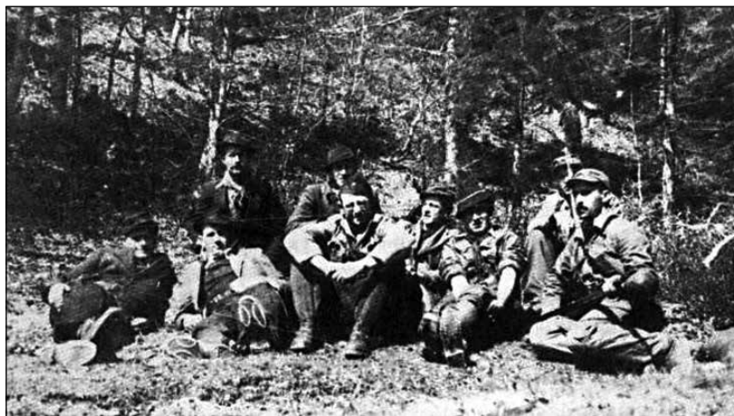
Štab Gorenjskega odreda pod Ratitovcem leta 1943.