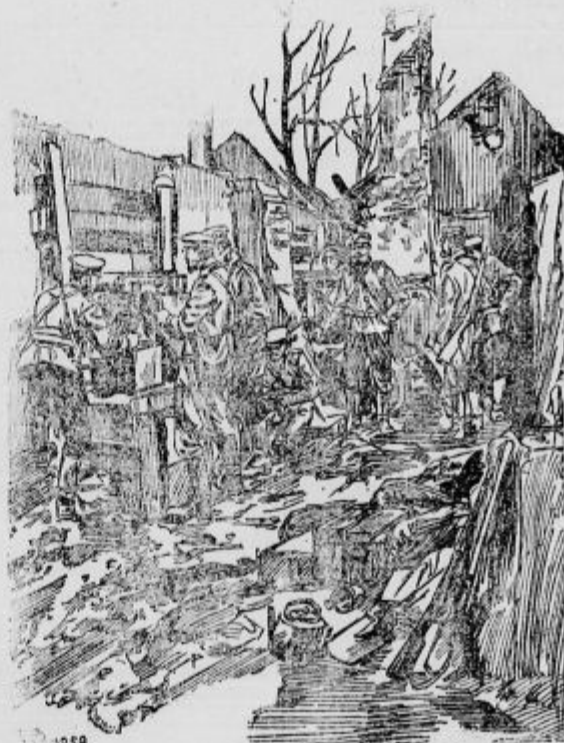
Rusko krifje v razdrtem poslopju.

Naprej in naprej! Naše čete prodirajo južno Kraljeva, Trstenika in Kruševca. Avstrijske čete so zasedle tudi važno po-