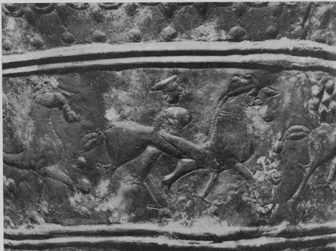
Sl. 6. Detajl s figuralne situle št. 2: jezdec z okroglim ščitom v desnici.