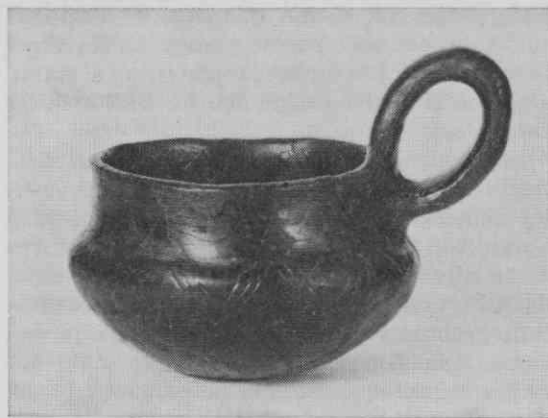
Sl. 2. Keramična skodelica-zajemalka iz figuralne situle št. 1.