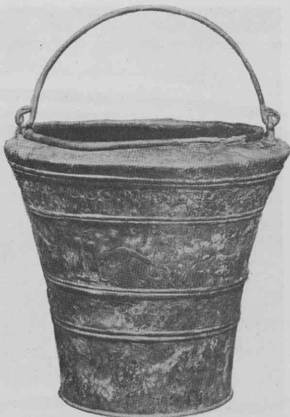
Sl. 4. Figuralna situla št. 2 iz knežjega groba (gomila IV grob 3). Na situli je upodobljen slovesen sprevod konjenikov, pešcev in konj. Višina situle 21 cm.

cev nimajo nakazanih rok. Vsi konji so enako stilizirano upodobljeni: enak jim je korak in vsi, tudi tisti brez jezdecov, imajo z drobnimi gravurami nakazano jezdno opremo na glavah in vratovih: jermenje, uzdo in brzdo. Vsi konji imajo žimnat čop na čelu izoblikovan v ostro konico, prstrižena griva je naznačena po vsej dolžini vratu z gostimi finimi urezi, rep je pri vseh spleten v kito in zavezan v stiliziran voz. Ušesa vseh konj so obrnjena nazaj in imajo neresnično rožičkasto obliko. Telesa konj so močno nesorazmerno upodobljena: medtem ko so vratovi, prsi in zadki močni in voluminozni, so hrbti oziroma trupi ozki in razvlečeni, noge so tanke in visoke. Kopita so izdelana poenostavljeno, močno poudarjeni pa so žimnati čopi na bincljih in skočni sklep. Drugemu, tretjemu in četrtemu konju visi iz gobca tanka vitica z buncico na koncu. Za hrbtom prvega in drugega konjenika sta upodobljena po ena stilizirana šesterolistna oziroma sedmerolistna roža s pomočjo iztolčenih buncic. Nad hrbti dveh neosedlanih konj visi navzdol po en stiliziran cvetni popek, pod konjskimi trebuhoma pa po ena iztolčena buncica. Konture vseh figur so na zunanji strani gravirane oziroma urezane z udarci zelo ozkega, finega dleta. Višina situle z ročajem 30 cm, višina situle brez roča-