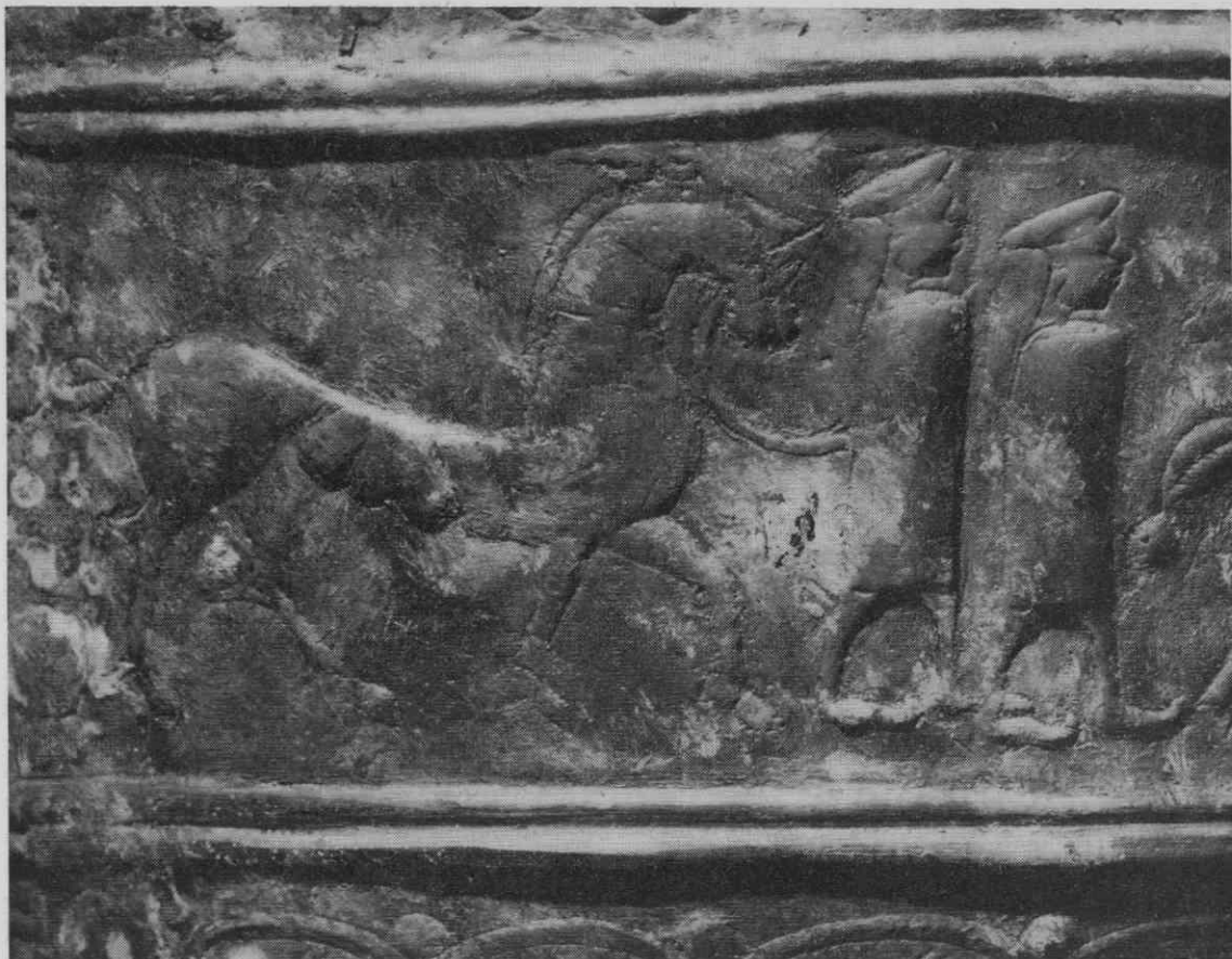
Sl. 7. Detajl s figuralne situle št. 2: dva moža peljeta na povodcu z vrečami obloženega tovornega konja.