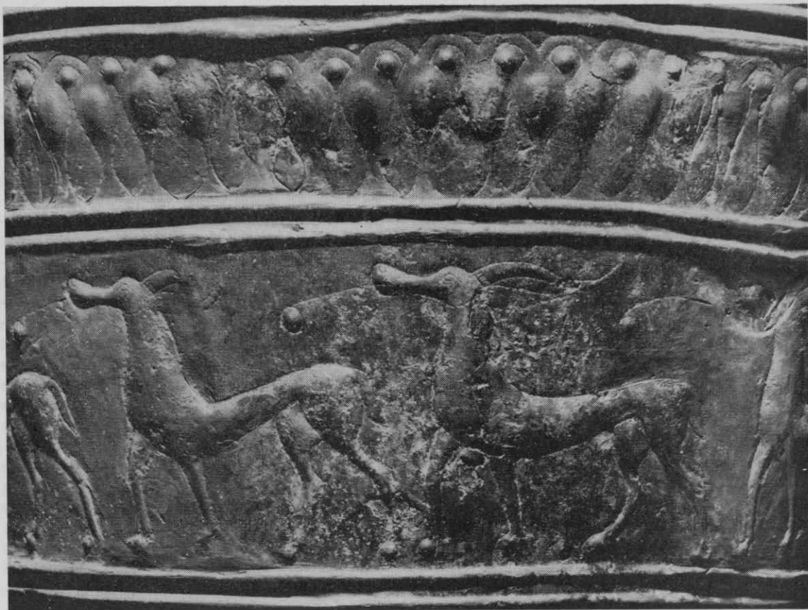
Sl. 5. Detajl s figuralne situle št. 1: stopajoči gazeli.