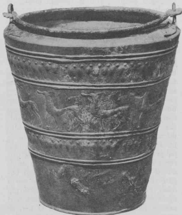
Sl. 1. Figuralna situla št. 1 iz knežjega groba (gomila IV grob 3). Na situli so v sklenjenem krogu upodobljene stopajoče gazele. Višina situle 21 cm.

1. Figuralna situla št. 1 iz knežjega groba 3 gomila IV (sl. 1). Situla je gladko konične oblike, njen plašč je izdelan iz dveh kosov bronaste pločevine in spojen dvakrat z osmi-