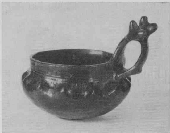
Sl. 3. Keramična zajemalka iz figuralne situle št. 2. Ročaj posode je okrašen z rogatima živalskima glavicama.