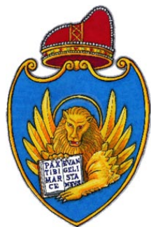
Krilati lev svetega Marka na grbu Benetk