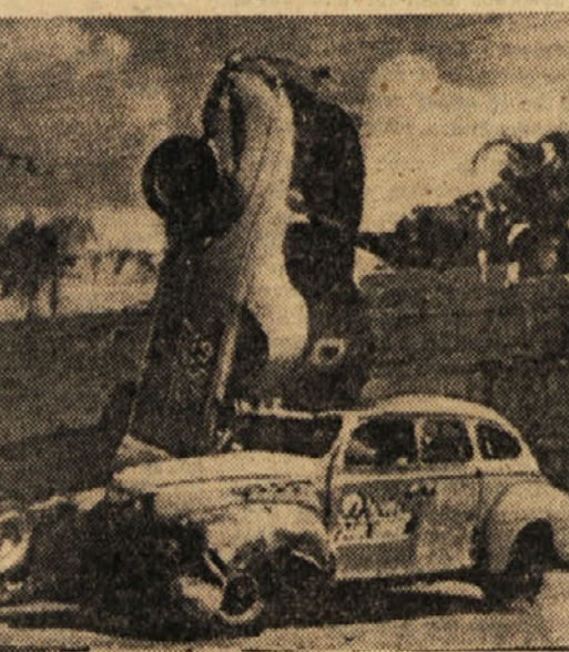
Nekaj metrov v zrak je poskočil tale avtomobil, čigar vozač ni pomislil, da so na cesti še druga vozila...

so se pripravljale za ta grozen poklic. »Sole«, ki so jih odkrili, so sicer razpustili, njihove voditelje pa poslali v zapor, toda ve se, da je takih »sol« mnogo in da še nadalje »obratujejo«.