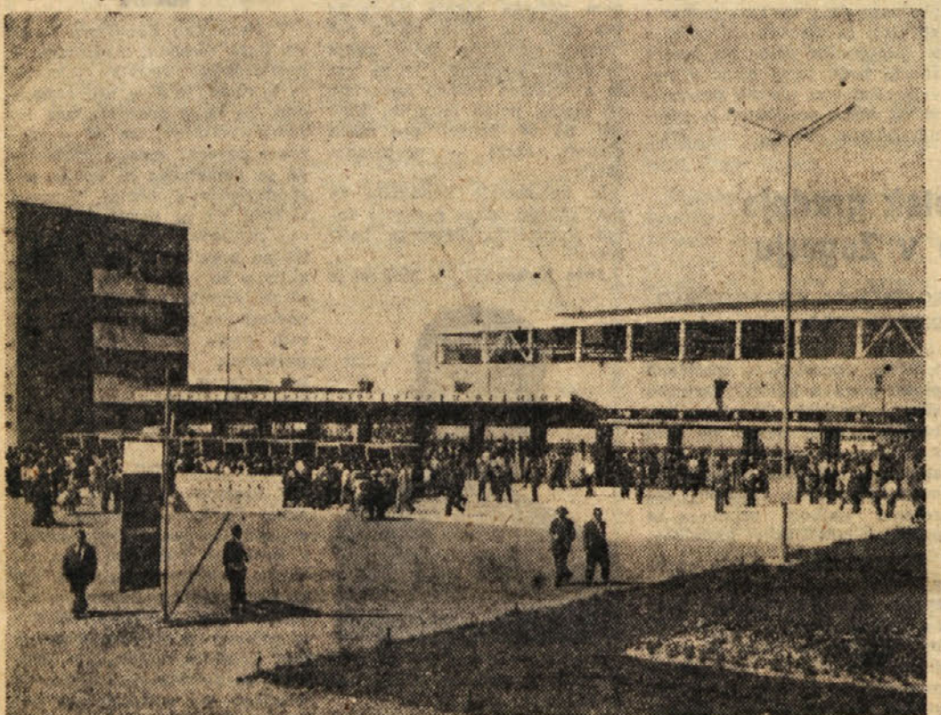
Zagrebiški velesojem je zlasti letos privabil mnogo ljudi iz vseh krajev Jugoslavije. Na velesojmurazstavljalos se več držav, kot lani in obiskovalci trdijo, da je izbira raznovrstnega blaga zdalečboljša kot lani. Na letošnjem velesojmu razstavlja tudi več zasavskih podjetij.