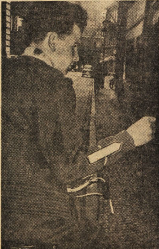
Predlog nekega kolesarja v mestih naj bi imeli kolesarji na rokavu pri-trjeno puščico iz fosforne snovi, ki bi zadaj vozčim avtomobilistom in drugim pokazala, da je kolesar premenjal smer. Puščico je mož pritrčiti na rokav z gumijastim obročem.

Le-ti jih naknadno prodajo ali ljudem, ki potrebujejo služničad, ali ljudem, ki potrebujejo prilice: zelo pogosto pa se dogaja, da ta dekleta prodajo v javne hiše.