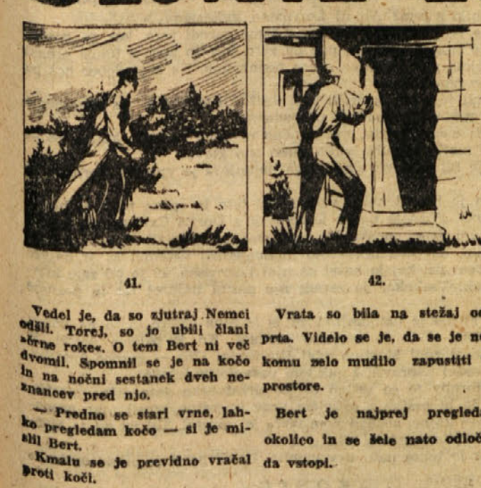
41. Vedel je, da so zjutraj Nemeč odšli. Torej, so jo ubili člani 'srne roke'. O tem Bert ni več dvomil. Spomnil se je na kočjo in na nočni sestanek dveh neznancev pred njo.

Dragi bralec! Če imaš hipec časa, te vabimo z nami, na Izlake. Radi bi ti pokazali, kako se tudi v tem priljubljenem kotičku, kjer je še do večera, predvčeršnjim, kipele občinskih razpoloženje, umika polje pred jesenjo. To pa ne bo edini namen našega obiska. Zvedela bova — še bova radovedna — kaj so tod nudili delovnim ljudem v zadnjih štirih mesecih, in morda bova nabrala kakšne vtise, ki si jih velja zapomniti.