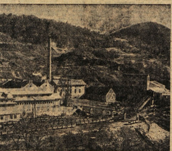
Del rudnika v Hrastniku