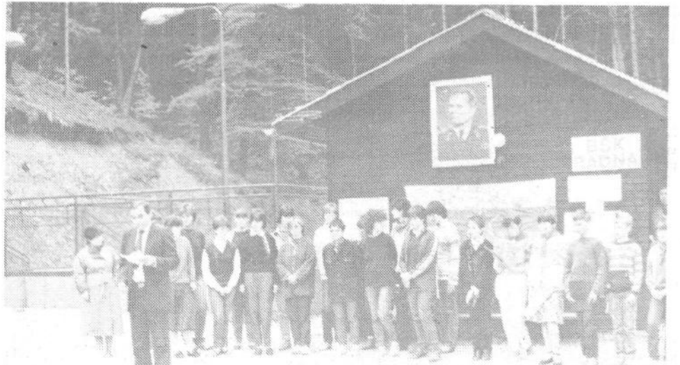
SLOVESNOST OB LETOŠNJIH JUBILEJIH – Na Brezovici si še niso izbrali datuma za krajevni praznik, 40-letnico osvoboditve pa so vseeno proslavili.