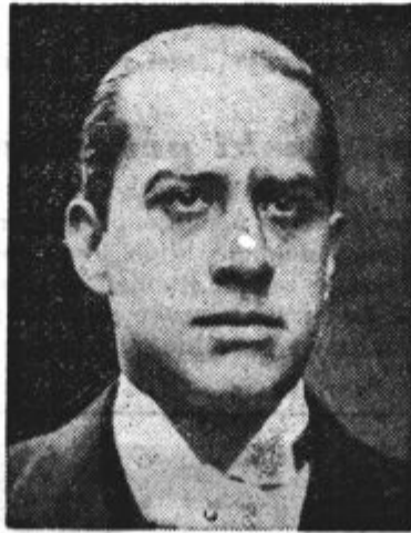
Italijanski zunanji minister grof Ciano