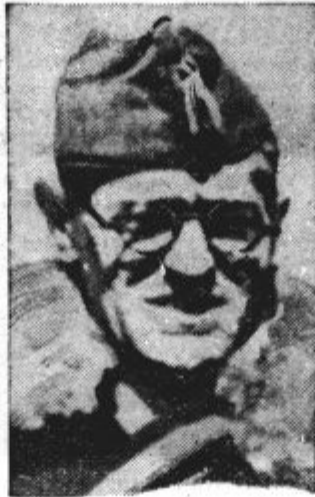
Francov general Moscardo, čegar čete so te dni po dolgotrajnih bojih zavzele mesto Tarragono

odložen. Poudaril je, da je tudi zato prišel v London, da pripravi ta obisk. Na koncu je Hungerford izjavil, da je ulstrska vlada pripravljena na vsako možnost, in da je Ulster odločen za zmerom ostati neločljiv del Velike Britanije.