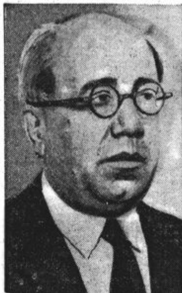
Prezident republikanske Španije Azana je pretekli ponedeljek odstopil.

Nekaj boljše je glede tega v Vojvodini, v Sloveniji in Bosni. Leta 1937. je bilo v Vojvodini in Bosni obsojenih po 11 požigalcev, v Sloveniji 12. Leta 1936. v Sloveniji 16, v Vojvodini 13, v Bosni in Hercegovini 6. Leta 1935.: Slove-