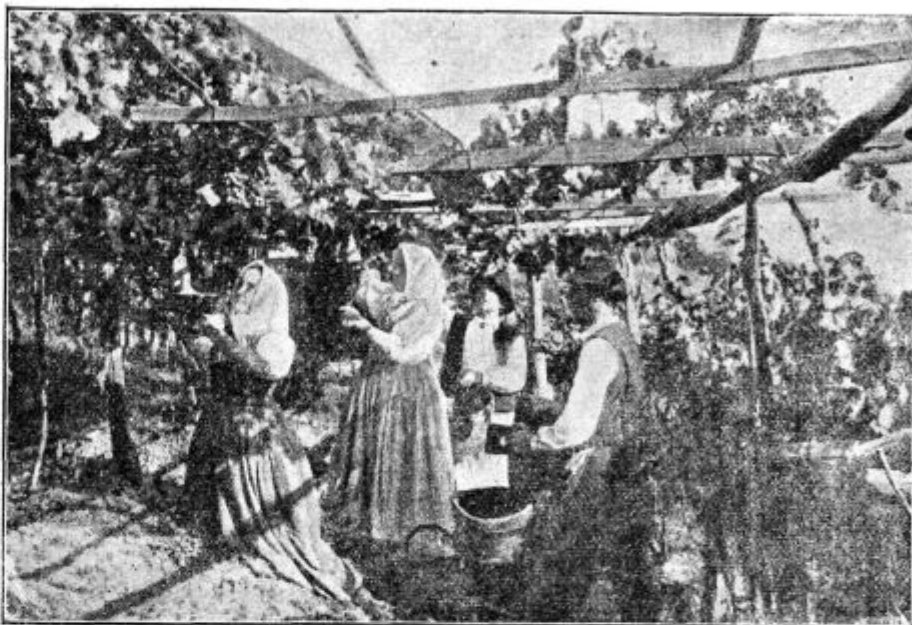
Podoba 68. Trganje za zdravljenje namenjenega namiznega grozdja na južnem Tirolskem.

češpljah in exoascus cerasi na češnjah in višnjah. Sorodne pavrste se nahajajo še na gozdnem drevju, na pr. na brezah, glogu, jelšah, gabru in hrastu, kjer povzročajo enako bolezen. V novejšem času so tudi na hrškah našli podobno glivico ( exoascus bullatus ), ki pa dosedaj ne dela posebne škode.