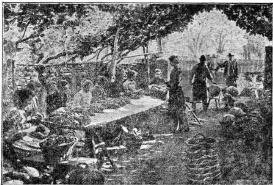
Podoba 69. Prebiranje, snaženje in zavijanje za zdravljenje namenjenega namiznega grozdja na južnem Tirolskem.

Vse poškodbe povzročata glivica na ta način, da njeno podgobje (micelij) rase pod zgornjo tenko kožico napadenih rastlinskih delov in jim izsesava hrano. Plod glivice (trosni meh = ascus) predero tenko listno ali sadno kožico, prerine na površje, kjer se razpoči, in seme