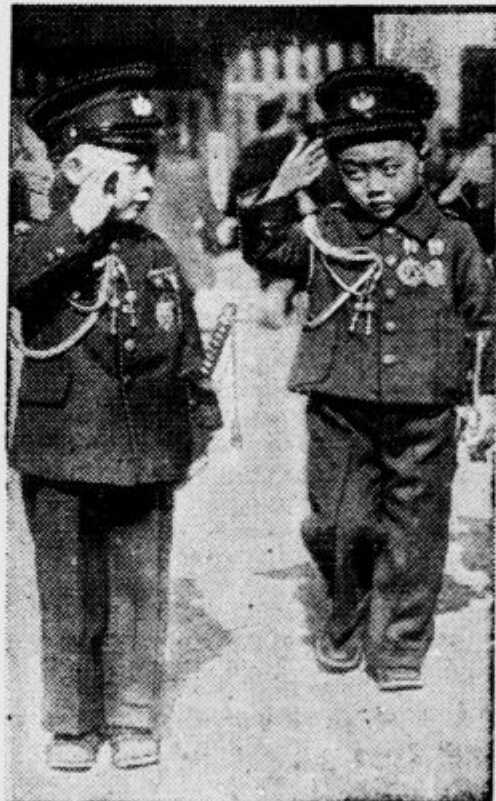
Japonci vzgajajo svojo mladino samo v vojaškem duhu. Že v deški dobi pošiljajo svoje sinove v vojaške šole, kjer paradirajo v uniformah