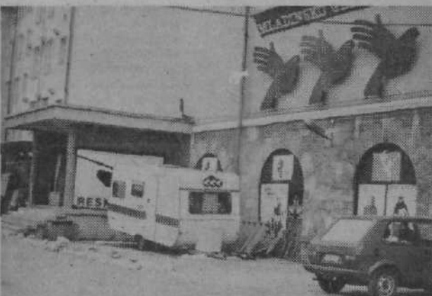
V mladinskem gledališču se nadejajo, da jim bo v prihodnosti uspelo zgraditi tudi skladišče, saj so zdaj kulise in druga oprema prepuščeni na milost in nemilost vremenu.

vo materiala in konstrukcij, so prebili zasilne izhode iz dvorane, prostor pa opremili s hidranti in negorljivimi vrati. Po temeljiti prenovi električnih napeljav, ki jo opravljajo delavci IMP tozd Elektromontaža, bo