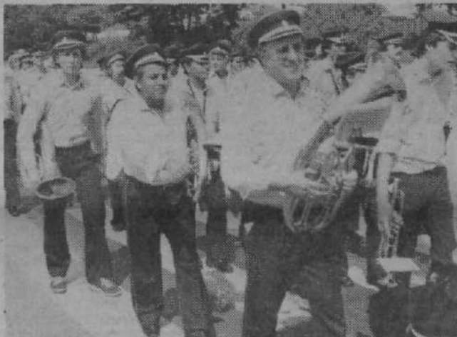
Pihalni orkester – Godba Bežigrad je nastopil tudi na lanskim Kmečkih ohceti v Ljubljani.

Pa še to. Pihalni orkester – Godba Bežigrad skrbi tudi za