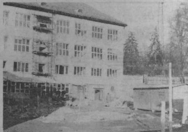
Pred petdesetimi leti, ko je bila šola zgrajena kot najsodobnejša daleč naokoli, je bila namenjena pouku 260 otrok. Danes drgne njene klopi 743 učencev in s temeljito prenovo, ki poteka to šolsko leto, bo usposobljena za spopad z naslednjo polovico stoletja.