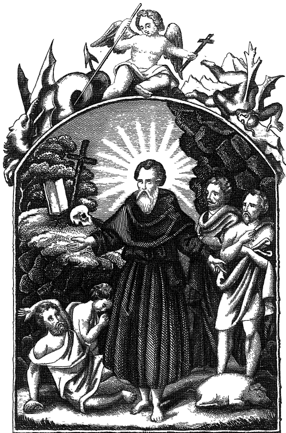
Sveti Anton, pušharnik.