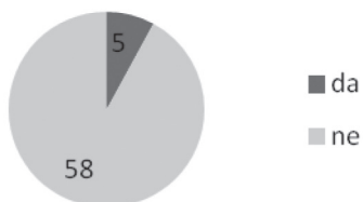
Graf 2: SPLETNE STRANI Z DRUGO NACIONALNO SIMBOLIKO ALI MITOLOGIJO (N = 63)

V smislu razporejenosti glede na vrsto akterja večino med njimi predstavljajo osebne spletne strani poslancev v Državnem zboru, ki jih je četrtnina, sledijo izvršne in druge državne institucije ter parlamentarne stranke vsaka s