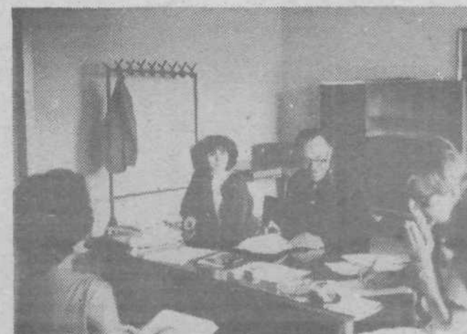
Z ustanovne skupščine drsalno — kotalkarskega kluba Stanka Bloudka