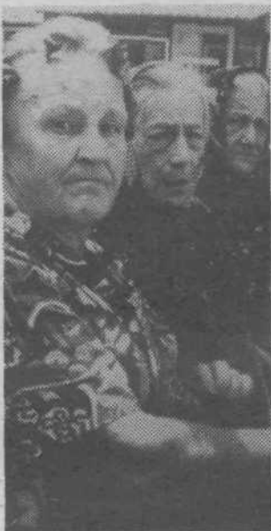
V delu je mladost: priznanja za najstarejše