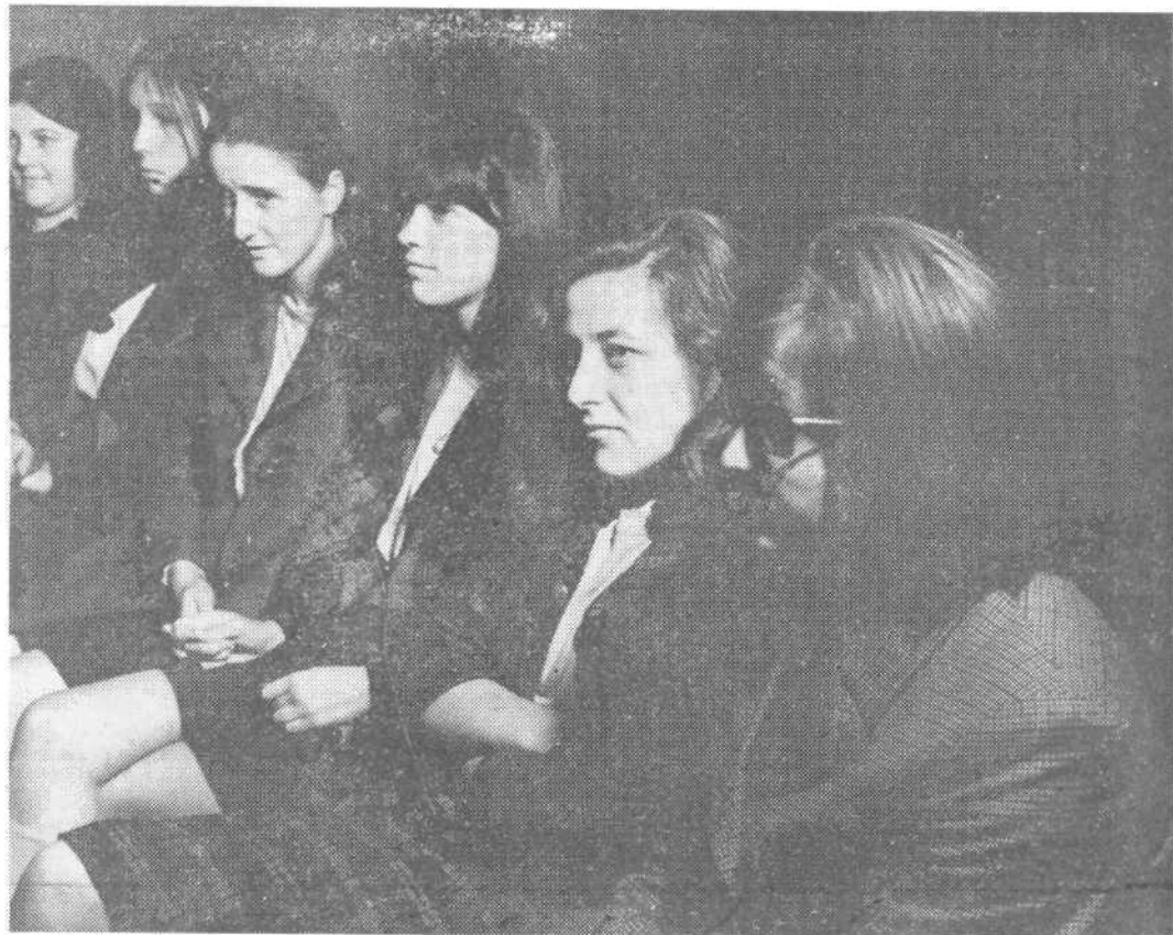
Mladina je pozorno poslušala izvajanja

• Oddajo ste verjetno gledali na televiziji, obširno reportažo o njej je objavil tudi Ko-