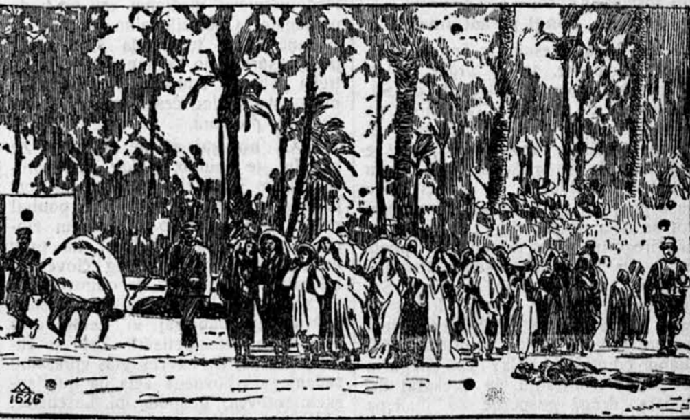
Gorenja slika nam kaže novo karakteristično sliko iz tripolitsanske vojne. Ujete žene in otroke peljejo laški vojaki iz oaze, kamor so bili pobegnili, nazaj v mesto. Tu gredo mimo kraja, kjer so bili italijanski vojaki dan poprej usmrtili mnogo Arabcev, katerih trupla še niso pokopana.

Iz Vevč. Štirinajst dni še manjka do občinskih volitev v D. M. Polju in takrat se bomo pošteno udarili. Naša občina je bila dosedaj vedno v rokah klerikalcev. Zato je že skrajni čas, da pomodemo z njimi enkrat za vselej in pošljemo v občinski svet može, ki bodo v resnici delali za kmeta in delavca ne pa samo za župnika. Boj bo tako hud, kakor morda v nobeni občini. Na dan stopa z jas-