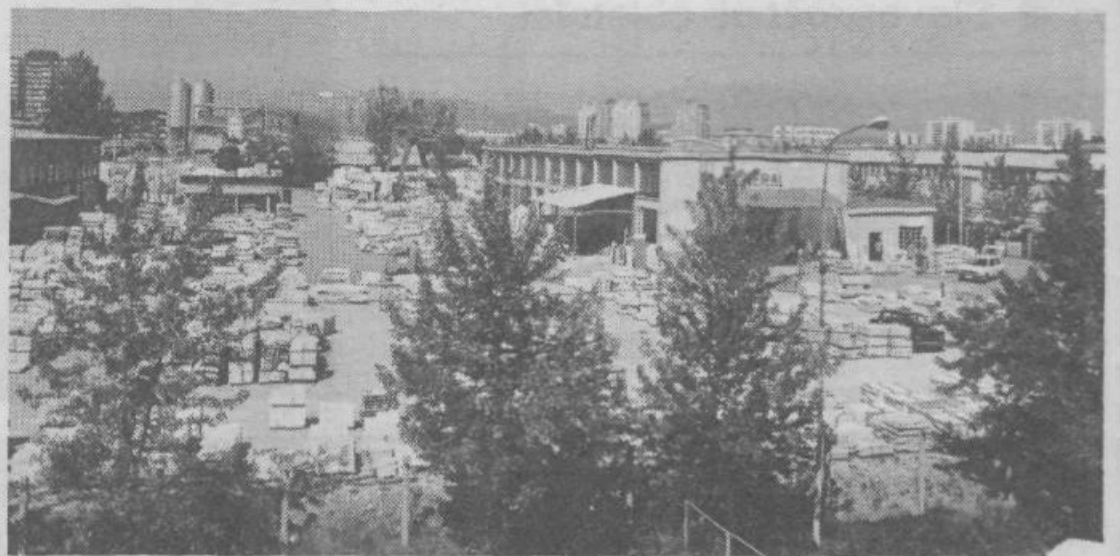
Pogled na Mineral na Letališki cesti

Vse največje stavbe, ki so bile v preteklosti zgrajene v Ljubljani, so tudi delo rok Mineralovih delavcev in njihovih kooperantov. V naravni kamen so oblekli Ljubljansko banko, Cankarjev dom, Plavo laguno, dom Španski borci in Smelt, njihovo delo je tlak v Čopovi ulici, da vrsto drugih manjših in večjih lokalov, tako družbenih kot zasebnih, sploh ne ome-