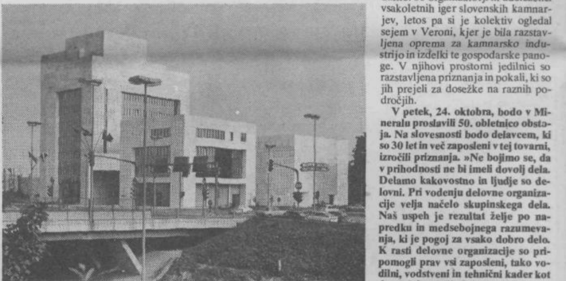
Nova poslovna stavba Smelta, ki je bila zgrajena prav pred nedavnim, je zunaj obložena z makedonskim marmorjem, imenovanim slvec.

kjer imajo prostor tudi strokovne službe in trije obrati: umetnega kamna, naravnega kamna in montaže. Tu imajo tudi prodajo, kjer si kupci lahko ogledajo vzorčne izdelke, dobijo vsa potrebna pojasnila in nasvete ter se domenijo za nakup. Iz naravnega kamna, predvsem iz različnih vrst marmorja, delajo tu okenske police, stopnice, plošče za stenske in fasadne obloge ter tlake, iz umetnega kamna pa teraco, prane in