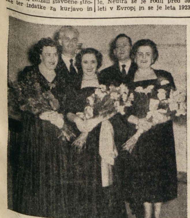
S koncerta Glasbene Matice v Avditoriju.

Nov pulman za nadaljnje uradniške, telegrafski, železniški odpravno in kdo v kakšno osebo še. Sledj voz z ločenimi oddelki. Nameščeni so v njem ponajveč fotografi. V drugem oddelkovnem vozu so washingtonski dopisniki različnih časopisov. Posebne odelčke imajo tudi radijski in televizijski poročevalci, vedno po dva in dva v oddelku. Tam stoji mize in ropotejo pisalni stroji. Raztreseno po vsem oddelku leže poletni časopisi, pisma, govori, priročniki, kopirni papir, srajke, ovratniki in rokavna pasja. Za vozom posebnih poročevalcev je navadno jedilni voz, ki ga ob prehodu na kako drugo pot vedno izmenjajo. Za jedilnim vozom - in zdaj so že vsi ljudje na peronu prav nestrajni - pride spet nov oddelkovni voz z novinariji, ki delajo za poročevalske urade. In za njim pride še en oddelkovni voz, preden dospemo do glavne osebe same. Ta voz je nepolnjen z ljudmi od tajne službe in s člani ministrstva. Be hiše ter s posebnimi povabilnimi gosti predsednika Trumana. V tem vozu je tudi pravo tainništvo s pisalnimi stroji, razno množevnim aparatom in vse praprogandno opremo.