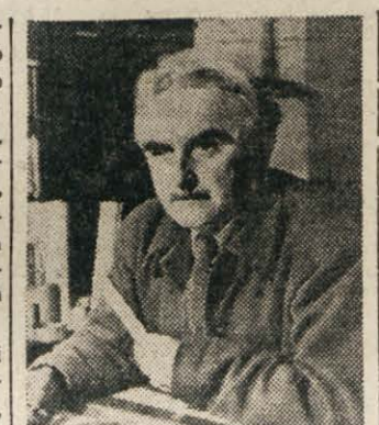
Ameriški arhitekt: Richard Joseph Neutra

Balkoni z okni, obokani hodniki in urejena dvorišča se skladajo s pokrajinsko sliko - Posebno pažno posveča arhitekt notranjosti stanovanjskih poslopj