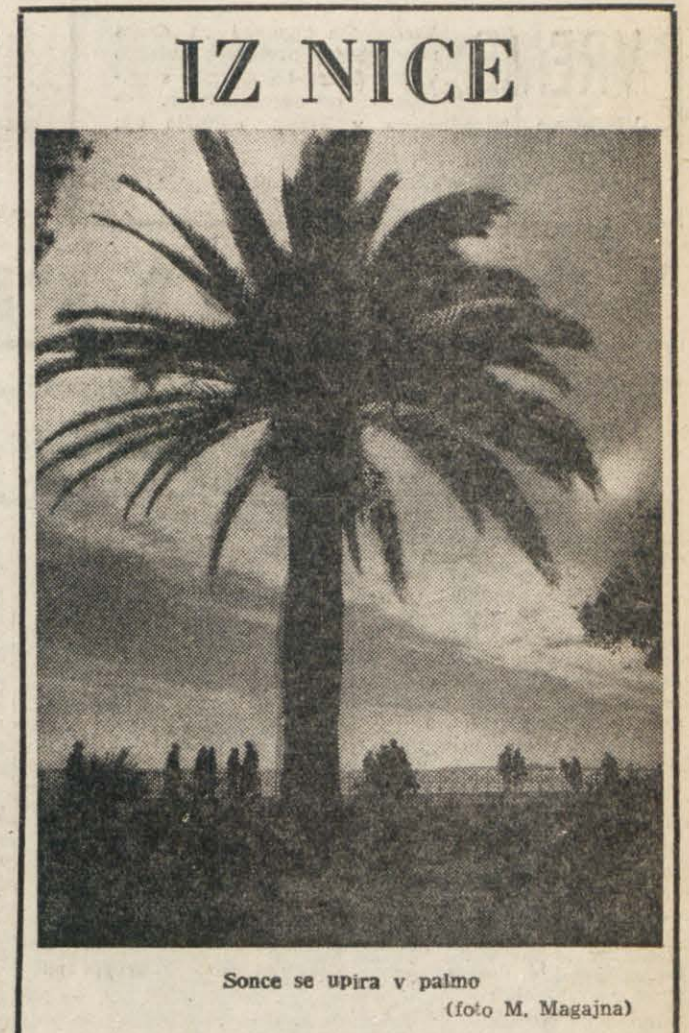
Sonce se upira v palmo

Velik vpliv na zaposlitev so imeli fašistični sindikati delodajalcev in delavcev, ki so po zakonu z dne 3-IV-1926, št. 563 edini smeli delovati. Slovenci in Hrvatstki delavci so bili izključeni iz sindikatov. Ti sindikati so imeli nalogo pospeševati poitaljanjenje naših delavcev. Sindikati so imeli velik vpliv tudi pri svobodnih poklicih advokatov in zdravnikov.