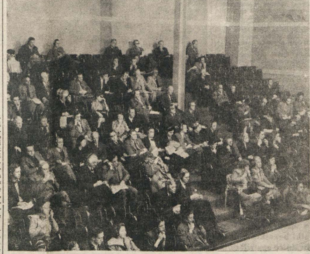
Mnoge države, ki niso vključene v OZN, ki pa jih delo te organizacije zanima, imajo svoje opazovalce v glavnih skupščinah OZN, ki navadno sedijo med občinstvom in brez formalnosti sodelujejo s predstavniki rednih članov, ko gre za vprašanja, ki zadevajo njihovo državo. V sredini druge vrste vidimo dva opazovalca Zahodne Nemčije, ki sedita razpravi v posebnem političnem odboru.

Meditan pa je svetlel namestnik atlantskega pakta in prvi sejo, posvečeno proučevanju načrtov za reorganizacijo NATO. Govoril so o tem, ali naj bi bil bodoči predsednik ali direktor Sveta Izvoljen ali imenovan, in o bodičih pooblaštilih glavnega tajnika. Za osnovo razprave služila ameriški in angleški predlog. Gre za to, da se atlantski organizaciji, ki se je precej birokratsko razrasla, podeli večja globina. Tudi Eisenhower je tu govori o potrebi bolj aerodinamične linije organizacije NATO.