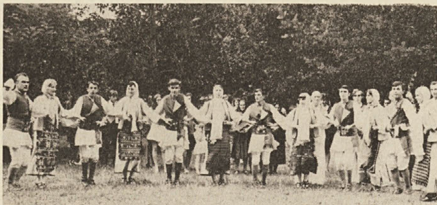
Folklorna skupina BRODOGRADITELJ z Reke.