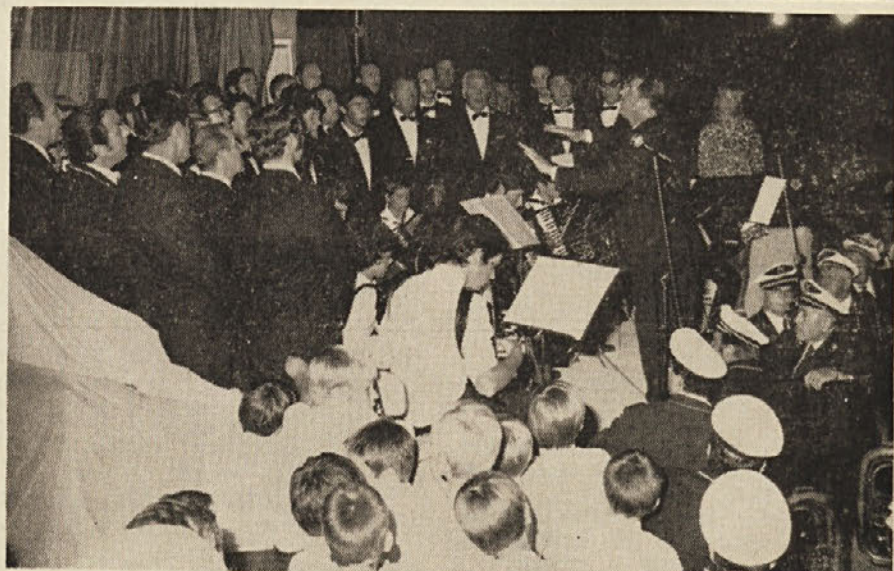
Na predvečer odkritja spomenika padlim borcem je bila na Proseku kulturna prireditev, katere se je udeležilo veliko številno hvaležnih domačinov in okoličanov.

Dalje podpisniki omenjene vloge zahtevajo, naj se v izvorni obliki pišejo imena tistih krajev, kjer pretežno prebivajo Slovenci. Pri tem se sklicujejo na prakso, ki velja v bociški pokrajini, kakor tudi na obmejnih področjih v Jugoslaviji.