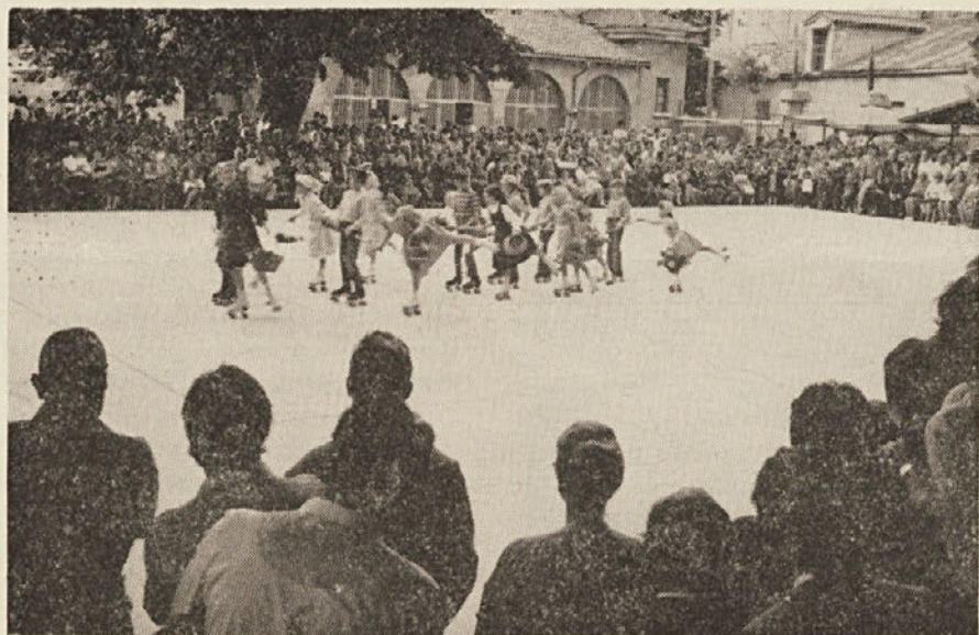
Dne 2. julija je bil na Opčinah tradicionalni partizanski tabor, ki ga je priredila krajevna sekcija bivših borcev. Na sliki: Mladi kotalkarji, ki so sodelovali pri kulturno-zabavnem sporedu, so številne udeležence prijetno presenetili.