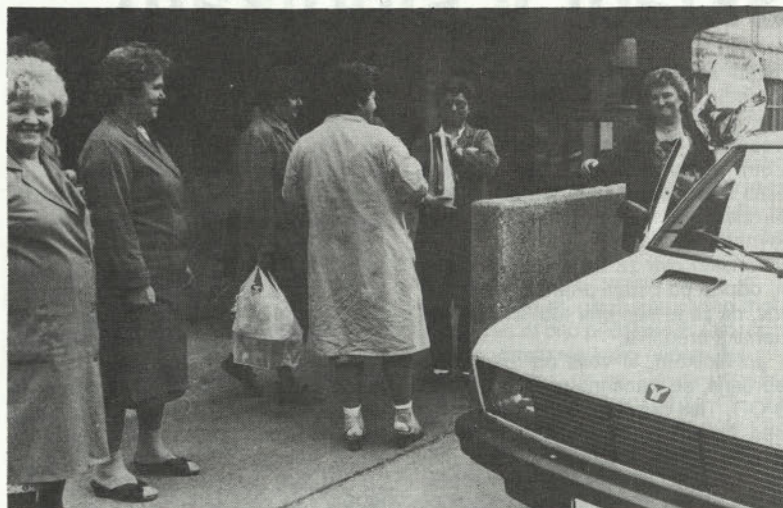
Na koncu zadnjega »šihita«. In potem tudi na ta dan ostane spomin.