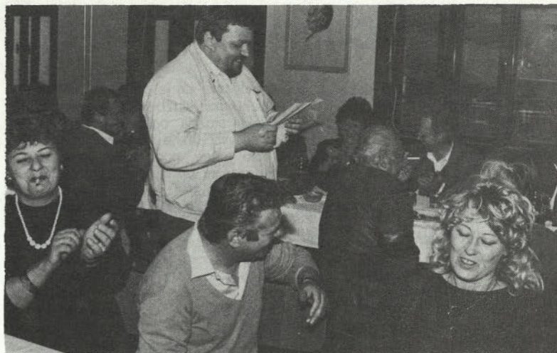
Ali pa: »Sprehod« skozi delovno dobo z manj resne plati.