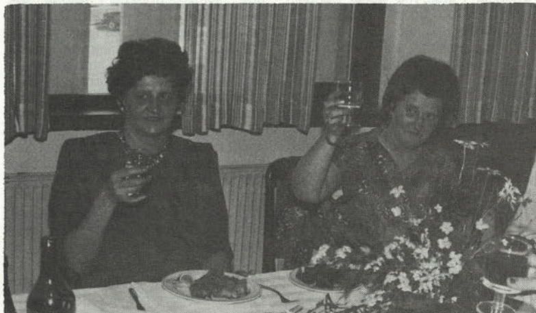
Na zdravje in najboljše želje odhajajočim.