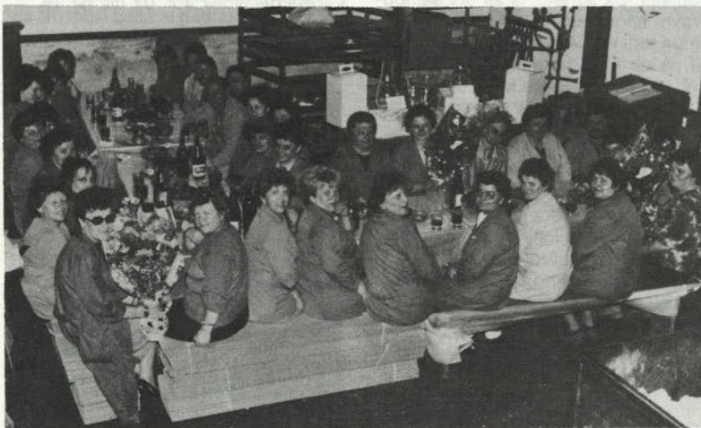
Leta teko. In ko pride še zadnji delovni dan, se zberejo sodelavci in prijatelji.