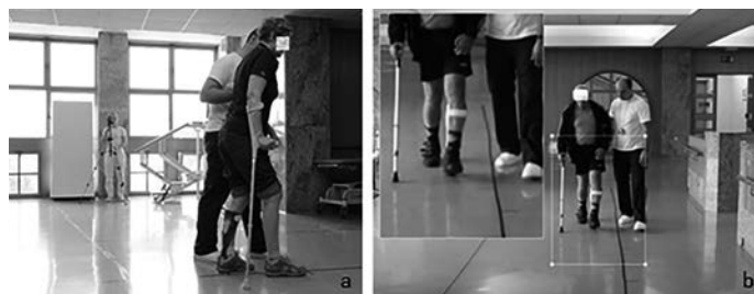
Slika 1: Snemanje hoje (a) in analiza hoje z opazovanjem z videoposnetkov s pomočjo računalniškega programa Kinovea (b).

Pri vsakem vključenem preiskovancu smo v naključnem vrstnem redu izvedli test sproščene hoje na 10 m po standardnem postopku (21) in klinično analizo hoje brez ortoze in z vsako od treh različnih vrst po meri izdelanih OGS. Po vsaki meritvi je sledil krajši počitek; v tem času je pacient zamenjal ortoza. Analizo hoje z opazovanjem smo opravili z ogledom videoposnetkov hoje od spredaj, s strani in od zadaj (Slika 1a) s pomočjo računalniškega programa Kinovea (verzija 0.8.15, Creative Commons Attribution 3.0, 2016), ki omogoča približevanje, ustavljanje in upočasnitev posnetka (Slika 1b). Analizo hoje sta izvedla dva fizioterapevta z več kot 20 let delovnih izkušenj. Uporabila sta nestandardiziran obrazec, s pomočjo katerega sta ocenila položaj glave, trupa in zgornjega uda, dostop, dolžino koraka ter gibanje kolka, kolena in stopala v fazi zamaha in fazi opore na lestvici od 0 – ni nepravilnosti do 3 – zelo izrazita nepravilnost.