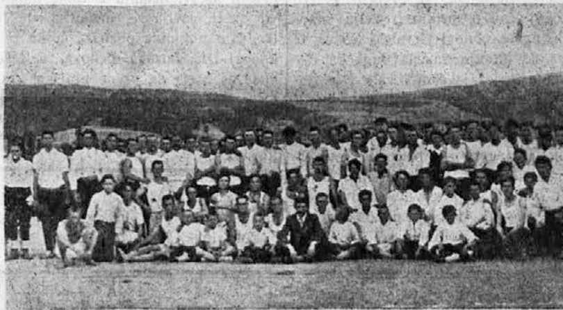
Članstvo Sokolskog društva u Nevesinju

den uspeji javni nastup. Održane su i utakmice sokolskih četa, posle kojih je izaslanik Nj. V. Kralja predao pobedničkoj četi Zatim srebren venac, dar blagopoč. Kralja Aleksandra. Uveče je održana svečana akademija.