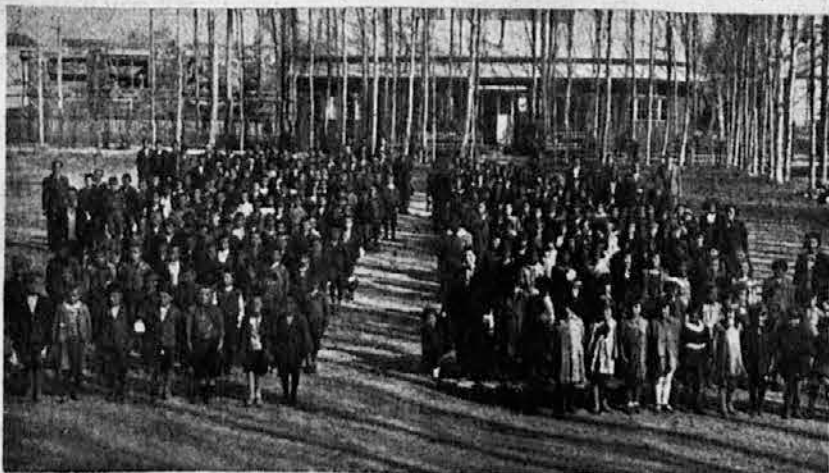
Чланови Соколског друштва Струга на излету

Braći i sestrama popust Cene vrlo solidne. Stručan rad Tražite cene za izradu ključa i značaka.