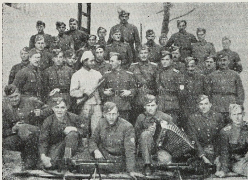
111. četa Slovenskega domobranstva na Lavrici.