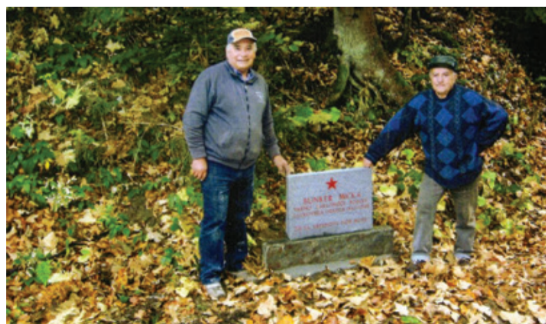
Urejeno okolje ob plošči v gozdu