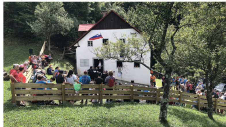
Bevkova domačija v Zakojci

Iztekle se je leto, ki je bilo v Mestnem muzeju Idrija posvečeno 130. obletnici rojstva pisatelja Franceta Bevka, hkrati je minilo tudi 50 let od njegove smrti. Pisatelj, pesnik, dramatik, publicist, prevajalec, partizan in častni občan Idrije je neločljivo povezan z idrijsko cerkljanskimi konci. Kot domačin je življenje in utrip teh krajev izjemno dobro poznal. S svojo ustvarjalnostjo in talentom mu je posebno mesto naklonil tudi v slovenski literarni krajini, zato je včasih imenovan kar za glasnika Cerkljanske. Vse življenje se je na moč trudil, da slovenska beseda dobi svoje zasluženno mesto. Koledarsko leto 2020 je bilo v spomin na pisatelja