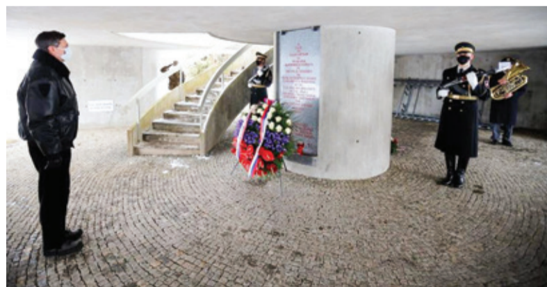
Predsednik Borut Pahor je položil venec k spomeniku v Dražgošah.

• V letu 2021 pričakujemo veliko novosti in sprememb, predvsem pa konec vseh mogočih viroz. Pričakujemo vlado, ki bo skrbela za državljanke in nas ne bo delila po svoji podobi. Smo država in narod, ki je sestavni del Evropske unije in tistega velikanskega dela naše celine, ki temelji na protifašizmu in protinacizmu. Smo nepogrešljiv del protifašistične koalicije, ki je premagala največje in najpogubnejše zlo prej-