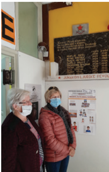
Spominsko obeležje v Osnovni šoli Žiri

Naj spomnimo, da je kljub odpovedi prireditve ob dnevu spomina krajevna organizacija ZB NOB spomin na dogodek 23. oktobra 1943 zaznamovala z obiskom trinajstih pomnikov narodnoosvobodilnega boja na Žirovskem in polaganjem simboličnih cvetličnih aranžmajev. Na sam dan praznika je delegacija krajevnega odbora obiskala spominska obeležja pri Merlaku na Žirovskem Vrhu, na Pretovču, pri tovarni Alpina, Dobračevi, na Selu ter pri Osnovni šoli Žiri.