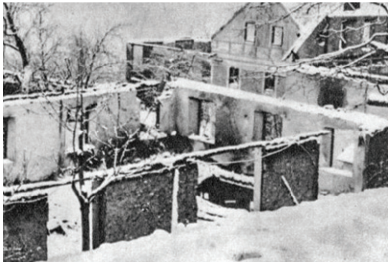
Nemci so vas požgali, nato pa še porušili.

• Kot skupno vseslovensko protifašistično organizacijo so ustanovili Osvobodilno fronto: ve se, da 26. aprila 1941 v Vidmarjevi vili v Ljubljani. Predstavniki KPS, krščanskih socialistov, demokratskega krila Sokolov in slovenskih kulturnih delavcev so na tem sestanku sprejeli znameniti program OF, ki je jasno oznanil upor Slovencev proti fašizmu. V nasprotnem primeru bi kot narod izginili.