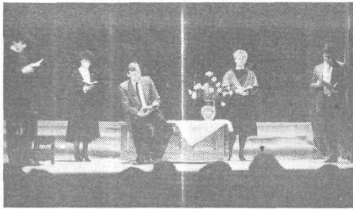
Tako naš in nam bližu je bil kulturni večer na Barju