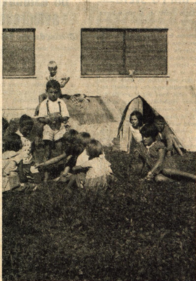
TABORNIKI SREDI MESTA