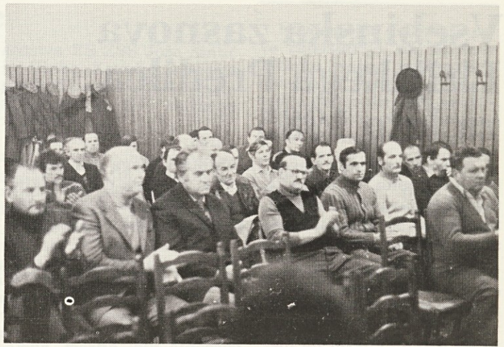
Udeleženci gasilskega občnega zbora

Predstavili smo tudi program dela in finančni plan IGD PL za leto 1985. Poudarek je na izobraževanju (gasilske vaje in strokovne ekskurzije), udeležbi na gasilskih tekmovanjih in sodelovanju pri preventivnih pregledih delovne organizacije s stališča požarne varnosti. V finančni plan je uvrščena tudi nabava gasilskega avto-