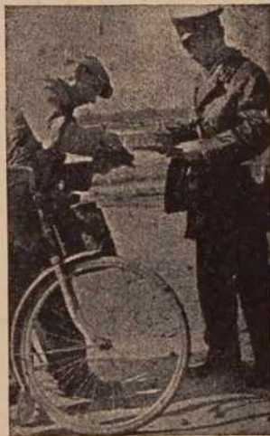
Najprej opozorilo — potem kazen

Ta akcija, pod naslovom »NA CESTI NISI SAM«, je potrebna zlasti zaradi nenehnega porasta motornih in ostalih vozil ter cestnega prometa. Po statističnih podatkih je bilo v Sloveniji ob koncu lanskega leta okoli 45 tisoč motornih vozil, približno pol milijona koles, preko 14 tisoč mopredov ter okrog 50 tisoč vprežnih vozil.