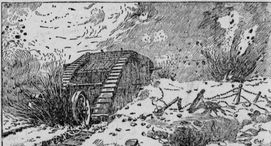
»Tank« ob napadu v bitki pri Arrasu.

Oživljena Poljska. Poljaki so ostali ravno taki, kakor so bili pred stoletji. Imeli so eno največjih držav v Evropi. Toda skoro vso zemljo so imeli plemiči, kmetje so bili tlačani in sužnji veleposestnikov, ki so napravljali gostije za gostijami in tako zapravljali krvave žulje svojih tlačanov. Judeje so posojevali denar in bili pravi gospodarji v deželi. Vse je bilo na prodaj — tudi vest in poštenost. — »Reichspost« poroča v 233. št. o gospodarstvu komisije za popravo Galicije, v kateri imajo Poljaki glavno besedo, sledeče: »Prebivalci Galicije so po večini Rusini, plemstvo je pa poljsko. Veleposestva so zelo obširna. Veliko najboljših gospodarstev je že v judovskih rokah. Po vojski je bilo poškodovanih ali uničenih 188.981 poslopij