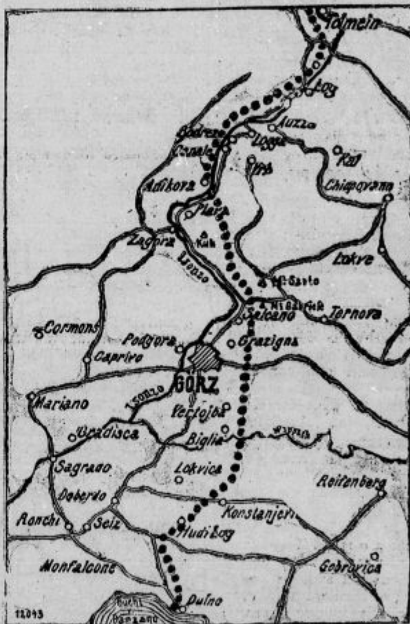
Zemljevid k deseti bitki ob Soči.

lijanom se to ni posrečilo. Naši so čakali pripravljene tudi na Krasu. Tu so zbeželi najsrdečiji boji med Kostanjevico in Grmado, ki so jo Italijani krstili kraški Gibraltar. Po angleškem zgledu so Italijani zbrali za svojimi naskakovalnimi četami konjenico, ki naj bi se bila takoj razlila proti Trstu, ako bi prodrli. Na okrog deset kilometrov široki bojni črti od morja do Kostanjevice je drobilo kraške skale nad 700 italijanskih topov, med njimi tudi angleške baterije. Takega ognja tu še ni bilo. Temu je sledil silen napad pehote, s katerimi so hoteli Italijani od severozapada obkoliti Grmado, toda to se jim ni posrečilo, dasi so vrgli v boj svoje najboljše čete in čeprav skoro dan za dnem iznova naskakujejo na tem prostoru.