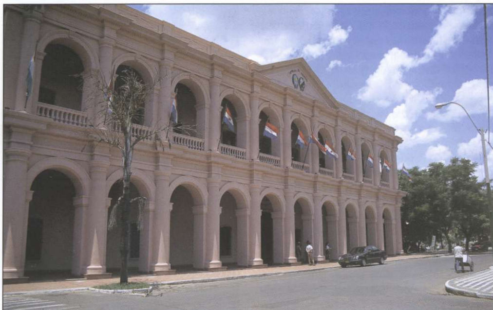
Slika 5: Asunción ni posebej moderno mesto. Še največjo privlačnost mu dajejo nekatere starejše zgradbe in številni senčni parki.

senčno zatočišče tudi ljubiteljem domina, igre, v kateri ob majhnih stavah številni glasno uživajo ure in ure.