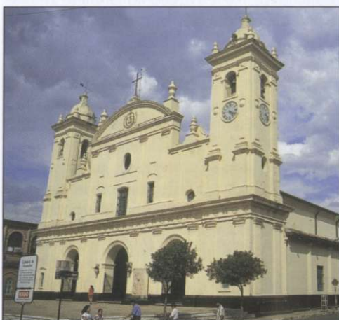
Slika 4: Večina prebivalcev je danes katoliške vere, o čemer pričajo številne cerkve.

Južno od Asuncióna turiste privabljajo ostanki nekdanj zelo uspešnih jezuitskih misijonov – redukcij, v katerih so dokaj dobro živeli tudi Indijanci Gvarani. Misijonarska naselja