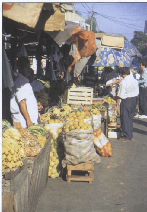
Slika 3: Trgovanje z vsem mogočim blagom je glavna dejavnost prebivalcev obmejnega mesta Ciudad del Este.

ljudmi pravcato armado ovaduhov, ki so neumno iskali državne sovražnike. S terorjem je diktatorju uspelo zadušiti tudi kulturno življenje, zato se je večina pisateljev, pesnikov in drugih umetnikov umaknila v tujino. Vračati so se začeli šele po njegovi odstavitvi, ko so Paragvajci končno svobodnejše zadihali.