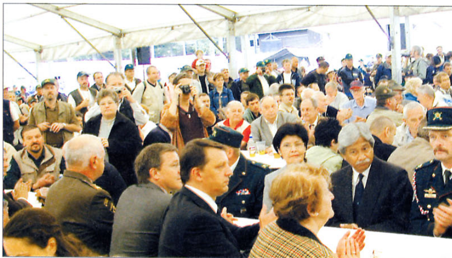
Privedite na Pokljuki so si ogledali številni visoki gostje.

»Naša dejanja so bila odraz organiziranega delovanja sistema ob podpori javnosti, kar je kljub kritičnosti do posameznih dejanj v slovenski družbeni in državni tranziciji preprečevalo tragične in necivilizirane pojave. Poznavanje dogodkov in naših aktivnosti, ki so potekale od leta 1989 v obliki preprečevanja mitingov in raznih razgrajaskih ter rušilnih pohodov, bojnih priprav, vojne leta 1991 ter v nadaljevanju pomembnih dejanj pri utrjevanju suverenosti ter pravne in demokratične podobe Slovenije, je pomembno s stališča »Kdor ne pozna preteklosti, ne more doumeti sedanjosti in neznanje mu omejuje razmišljanje in predvidevanja o prihodnosti«. Veterani vojne za Slovenijo, ki so leta 2001 uresničili misel o športnih igrah veteranov, katerih ideja je bila popularizacija veteranstva, večanje pripadnosti, množičnosti slovenskih veteranov in nasploh mednarodno druženje veteranov z različnimi oblikami športno-rekreativnih tekmovanj, so se odločili na podlagi proučevanja in spoznanja lastne zgodovine in prišli do zaključka, da igre pozitivno vplivajo na krepitev zavesti in identitete veteranstva. S takšnim namenom je bilo letošnje 4. srečanje veteranov Združenja Sever in Zveze veteranov vojne za Slovenijo tudi organizirano, kar potrjuje tudi geslo srečanja »VETERANI ZA MIR«. Veterani Združenja Sever zato ne moremo mimo izjav v slovenskem parlamentu in izražamo protest zaradi politiziranja tega športnega sreča-