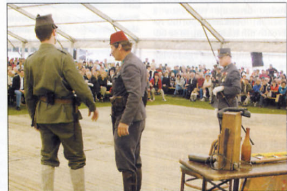
Skupina »drajcen-drajcen« je s svojimi skečem s soške fronte spravila zbrane v dobro voljo.