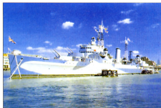
Druga svetovna vojna 1939-1945: iz tistih časov Britanci hranijo še edino preživelo evropsko krizarko, ki je zdaj neke vrste pomorski muzej in je zasidrana na reki Temzi, ki teče skozi britansko glavno mesto London.