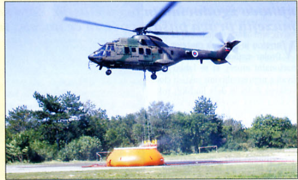
Zaradi svojih zmogljivosti bodo novi helikopterji uporabni predvsem pri gašenju požarov, saj lahko v večji odpeljejo na pogorišče več kot tri tone vode.