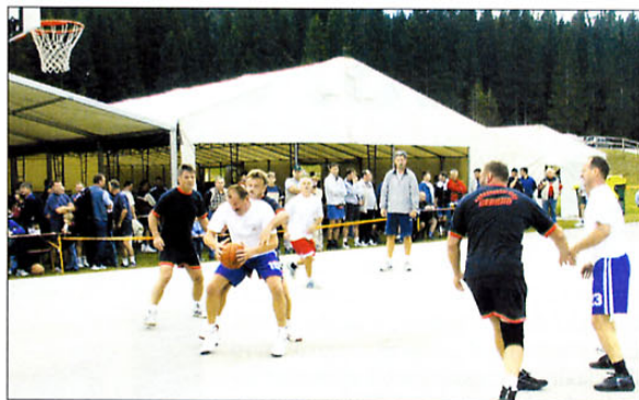
Košarkarji so navdušili gledalce z uspešnimi meti in atraktivnimi podajami.