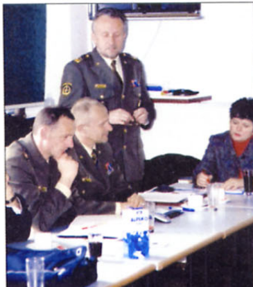
Brigadir Anton Turk seznanja člane predsedstva ZVVS s prihodnjim razvojem Slovenske vojske.

Tako je strokovna služba vsa območna združenja pozvala, naj ji posredujejo morebitne pripombe na Statut ZVVS, v izdelavi sta dva tipska obrazca za vodenje materialno-financijskega poslovanja območnih združenj in dejavnosti združenj ter, kar je najpomembnejše, dopolnila oziroma spremembe Zakona o vojnih veteranih se »premikajo«. Tako je Ministrstvo za obrambo že izdelalo svoj predlog in ga tudi poslalo v usklajevanje na Ministrstvo za delo, družino in socialne zadeve. Po zadnjih informacijah bo v predlogu odpadla starostna omejitev 50 let za invalide 2. in 3. kategorije; status vojnega veterana bodo lahko dobile nekatere osebe, ki so opravljale določene naloge obrambe in zaščite, pogajalci in pazniki v zaporih, kjer so bili zaprti oficirji JLA; priznana pokojninska doba za čas vojne ne bo več »posebna«, temveč »delovna« ... Dobili smo tudi podporo v naši zahtevi, da se