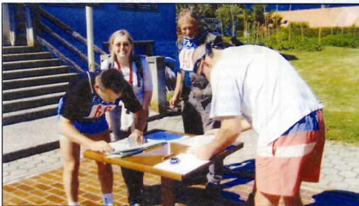
Ekipa OZVVS Bela krajina med reševanjem naloge.

Območno združenje veteranov vojne za Slovenijo Kočevje je že šestič organiziralo tekmovanje v vojaških veščinah v počastitev dneva državnosti. Tradicionalno tekmovanje je potekalo po kočevski dolini, start in cilj sta bila pred gostilno Lovšin.