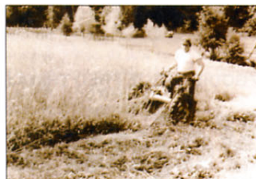
Teritorialci, ki so ga klicali »Rambo«, s puško na rami kosili travo pri bližnjem kmetu.

pa smo jo doživljali vsak na svoj način in s svojimi občutki tudi v naši dolini, pa čeprav ni bilo streljanja in žrtev. Vsekakor pa smo bili pripravljene tudi na najhujše in odločeni, da se z vso silo in vsemi sredstvi postavimo po robu agresorju.