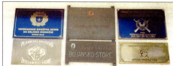
Na Vrunčevem lovskem domu odkrili spominske plošče veteranom, častnikom, veteranski organizaciji Sever, letos pa so jo Planinskemu društvu Štore.