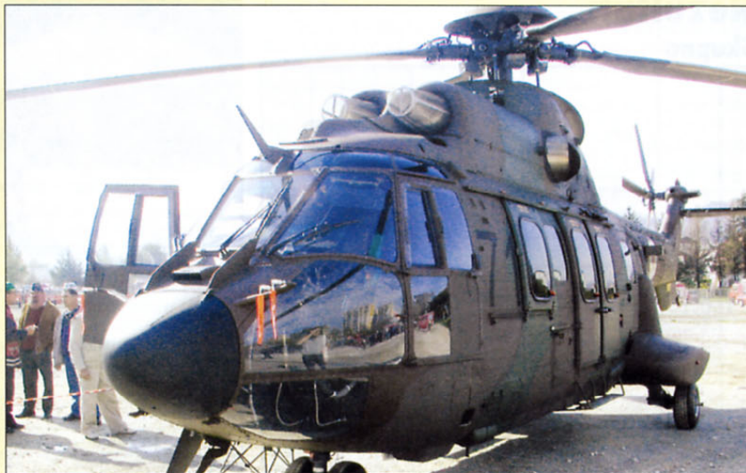
Pogled na helikopter AS 532 AL cougar

Večnamenski transportni helikopter AS 532 AL cougar evropskega izdelovalca Eurocopter pomeni najsodobnejšo izpeljanko helikopterja super pume, ki je prvič poletel leta 1978. Njegovo posadko sestavljajo pilota in tehnik letalec, poleg njih pa je v potniški kabini prostor še za 24 vojakov ali drugih potnikov. Glavna naloga cougarja je prevoz vojakov in njihove opreme. Poleg tega se lahko uporablja za prevoze večjih tovorov, evakuacijo ranjencev in civilistov z ogroženih območij, za reševanje na morju in v gorah, metanje padalcev itn. Primeren je tudi za gašenje požarov, saj v posameznem letu prepelje do 3000 litrov vode, kar je trikrat več kot bell 412.