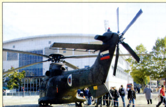
Takšen je cougar od zadaj.

Ker dvigne 3500 kg tovara, lahko nanj namestijo različne dvigalke. Tako se pod helikopter namesti prosta kljuka, na katero se obesi tovor, težak do 3000 kg. Če namestijo kljuko