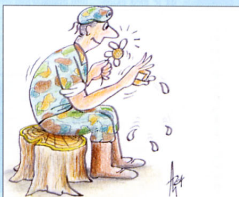
Veteranova dilema: »Grem na Geoss, grem v Divačo...!«