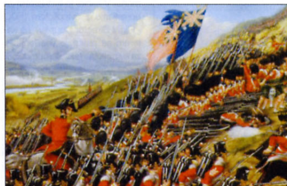
Krimska vojna leta 1854: naskok britanskih čet

Preden opišemo nekaj podrobnosti iz muzeja, naj povemo, da v National Army Museum ne poznajo vstopnine. Pričakovali bi, da se takšna ustanova financira iz vojaškega proračuna, da ga financira država. Vendar je to samo delno res, saj večino denarja zberejo drugače. Posebej zanimiv je tako imenovani Klub prijateljev Nacionalnega muzeja kopenske vojske. Njegovi člani prispevajo določene vsote denarja za delo te ustanove. Takšen način financiranja se je pokazal za zelo učinkovitega, saj je v Veliki Britaniji veliko ljudi, ki so pripravljeni