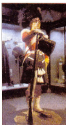
Krimska vojna leta 1854: vojak enega od škotskih polkov, ki so se bojevali na tem črnomorskem polotoku.

Ta oddelek je še posebej zanimiv za tiste, ki so sami služili vojsko. V njem je prikazano, kako so mladi fantje kot vojaki služili v britanski vojski in državi po letu 1945. Zade-