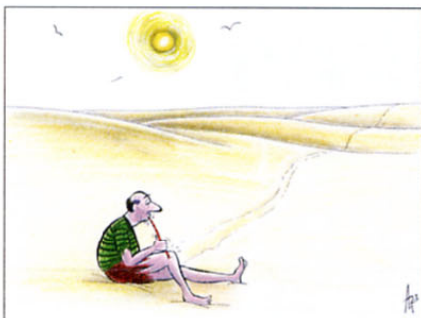
V puščavi je dobra tudi voda v kolenu.