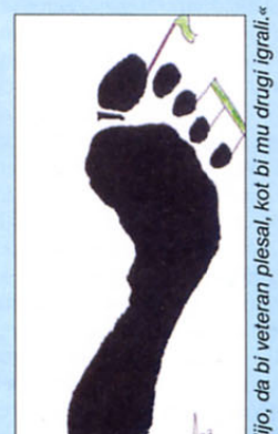
»Želijo, da bi veteran plesal, kot bi mu drugi igrali.«