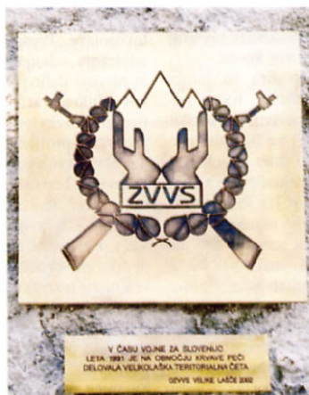
Spominska plošča, ki spominja na dogodek v vojni za samostojno Slovenijo.

Ob tem ne smemo pozabiti na strokovno in