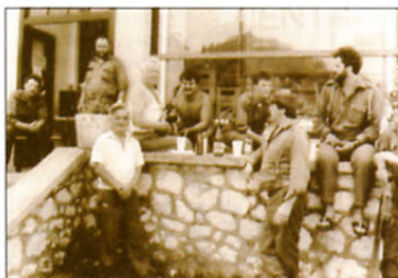
V prostem času, ki pa ga ni bilo veliko, so se teritorialci nekoliko sprostiti, popili pivo in se pogovorili z domačini.