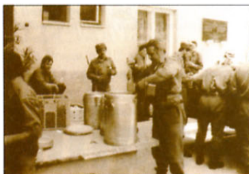
Po štiriindvajseturnem dežurstvu se je večerja v bazi še kako prilegla.

»Ko zdaj delamo različne analize, vedno bolj ugotavljamo, da je bil strateški poseg našega območja dobro začrtan in da je bil temu primeren tudi rezultat. Ugotovili smo, da smo s svojimi strokovnjaki in kadri, poveljujočimi po enotah in tudi v štabu, napravili ogromen poseg v tisto, kar smo imeli začrtano med to vojno. Seveda pa gre za to predvsem zahvala in pohvala našemu kadru, ki je vodil posamezne enote - strokovnjakom, ki so se resnično zavzemali na