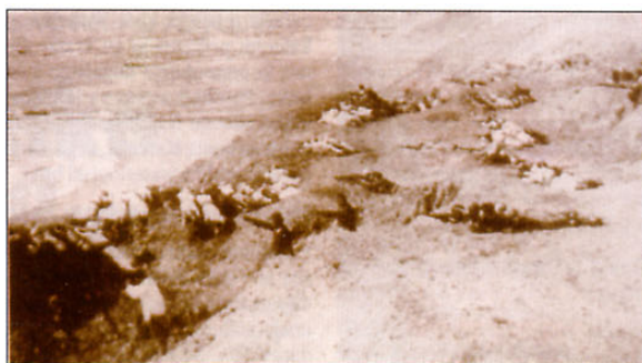
Turška pehota čaka na začetek prvega zavezniškega izkrcanja na polotoku Galipoli. Večina vojakov je oblečena v bele poletne uniforme, ki so jih nato dokaj hitro odpravili.

Za turško sultanovo vojsko v veliki vojni se pogosto, podobno kot za samo cesarstvo zdi, da ji je dominirala imperialna Nemčija. Večino del o turški vojski so napisali nemški častniki