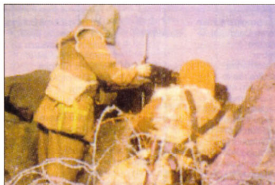
Prva svetovna vojna 1914-1918: britanska vojaka z mitraljezom in zaščitnima maskama na obrazu v bitki pri Ypresu v Belgiji leta 1915