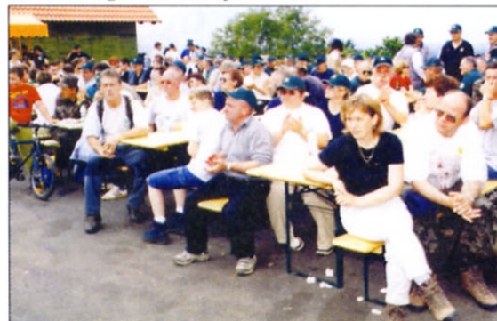
Pohodniki so z veliko pozornostjo sledili dogajanju na balkonu zgradbe, v kateri je Maistrova soba.