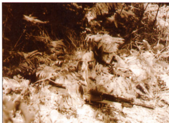
Teritorialci na položaju. Skriti v gozdu so pozorno opazovali cesto in promet na njej. Orožje v njihovih rokah je bilo pripravljeno na strel.