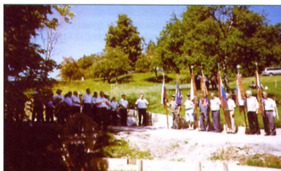
Utrinek s proslave v Ločah

Mnogo trpljenja in gorja, bede in pomanjkanja so pretrpeli, mnogo žrtev je bilo, da smo lahko dočakalo to, kar uživamo danes. Res življenje teče