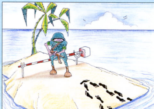
»Čez zapornico samo z dovolilnico!«