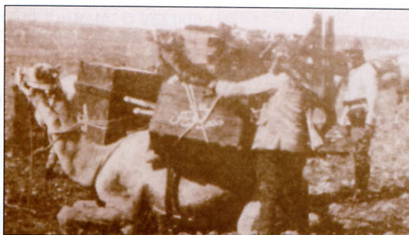
Turška vojska je na iraški fronti za transport orožja in opreme uporabljala predvsem kamele, saj so se najbolj obnesle v puščavskih razmerah. Britanci so za to spoznanje potrebovali kar nekaj časa. Slika je nastala leta 1916.

Decembra 1913 je v Carigrad prispel najbolj znan nemški svetovalec Liman Von Sanders, član spreobrnjene pruske židovske družine in mož, ki bo pozneje bogato vojaško znanje in spretnosti pokazal proti Britancem v Galipoliju in Palestini. Von Sanders in še približno 40 drugih nemških častnikov je začelo v turški vojski služiti pozimi 1913-1914. Kljub velikim naporom jim do začetka 1. svetovne vojne ni uspelo dokonč-