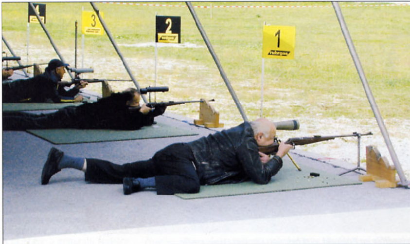
Na ognjeni črti

no sodelovanje v mednarodnih organizacijah in ustanovah praktično vse od svoje osamosvojitve naprej. Odločitev za včlanitev v zvezi Nato je tako postala bistvena sestavina vseh državnih in vladnih programov v zadnjih enajstih letih in o njej je ves ta čas obstajalo široko politično soglasje v državi. Za Slovenijo je pomenilo povabilo zveze Nato k pristopnim pogajanjem leta 2002 na praškem vrhu priznanje za storjen napredek v desetletju naše državnosti. Priznanje, da se je Slovenija preobrazila iz prejemnice varnosti v kreatorko varnosti. Zato smo ponosni, da je Slovenija letos postala članica dveh najpomembnejših organizacij – Evropske unije in Nata. To članstvo je naša zaveza za še bolj dejavno vključevanje naše države v širši mednarodni prostor. Hkrati pa razumemo članstvo v Natu kot okvir in sredstvo, s pomočjo katerega lahko na izkušnjah in temeljih, ki ste jih vi pomagali graditi, vzpostavimo sodobno in dobro izurjeno Slovensko vojsko. Ta predstavlja temelj varnosti naše države in je naš prispevek h kolektivni obrambi zaveznic, pa tudi varovanje miru po svetu na mirovnih misijah z mandatom OZN. V naslednjem letu čaka Slovenijo nova odgovorna in pomembna naloga, saj v letu 2005 prevzemamo predsedovanje Organizaciji za varnost in sodelovanje v Evropi (OVSE). Doslej smo s predsedovanjem Varnostnemu svetu Združenih narodov leta 1998 že dokazali, da smo kos zahtevnim varnostnim nalogam. Predsedovanje