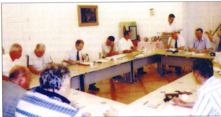
Seja predsedstva ZVVS v Rakičanu pri Murski Soboti

Delovna srečanja s sekretarji območnih združenj, ki jih organiziramo dvakrat letno, so se pokazala kot dobra oblika dela. V Žalcu je bilo največ govora predvsem o novem vodenju članske evidence. Letos smo uvedli sistem, po katerem v območnih združenjih sami vnašajo ali spreminjajo vse podatke o svojih članih (spremembe naslovov, podatke o plačilu članarin ...) ter sami vnaša-