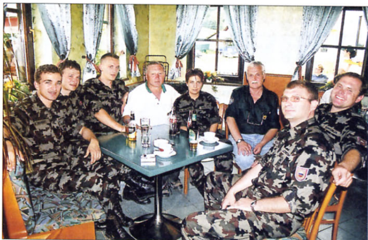
Konec dober, vse dobro po zaključku pohoda v Lenartu

jo podatke o novih članih, ki jim v strokovni službi samo dodamo člansko številko, in to tako, da so vse spremembe dobesedno sočasno opravljene tudi v centralni evidenci. Vsi podatki so zaščiteni tako, da nepoklicani do njih nimajo dostopa.