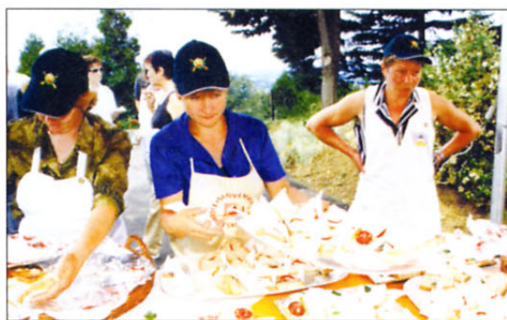
Za prigrizek so poskrbele z domačimi dobrotami članice aktiva kmečkih žena.