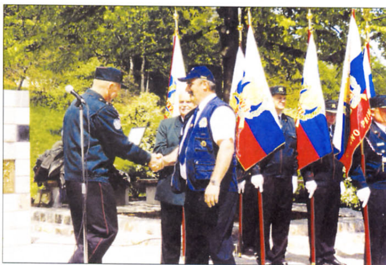
Podelitev spominske plakete ZVVS Združenju Sever ob njihovi deseti obletnici.

Letošnji 17. maj - dan ZVVS smo veterani praznovali ob našem pomniku na Geossu.