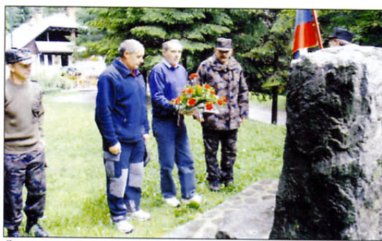
Štiričlanska delegacija članov OZVVS Tržič je k spominskemu znamenju, ki so ga ob deseti obletnici vojne za Slovenijo postavili pri nekdanji stražnici na Ljubelju, položila cvetje.

Večer je minil v prijetnem veteranskem druženju in obujanju spominov na vojno 1991.