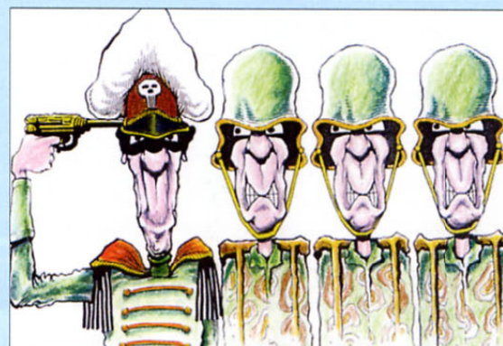
Varčevanje s strelivom