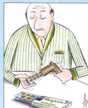
Kako ubiti glavobol