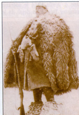
Turški vojak na straži na vzhodni fronti v Galiciji. Slika je nastala leta 1916. Vojak ima ogrnjeno pelerino iz kožuha, ki so jih kmetje v Anatoliji uporabljali vse od 6. stoletja.

ker Nemčija ni imela očitnih interesov na Srednjem vzhodu. Pomembnosti teh misij ni mogoče spregledati, še posebej pri usposabljanju in izobraževanju nižjih