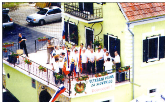
Končni cilj pohodnikov je bila zgradba v Zavrhu, v kateri je spominska soba generala Rudolfa Maistra.