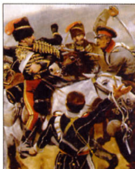
Krimska vojna leta 1854: britanska lahka konjenica v napadu

Pozornost obiskovalcev pritegneta žaga, s katero so amputirali nogi