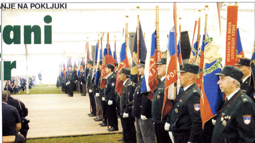
Poseben slovesen poudarek so prireditvi na Pokljuki dali praporščaki s svojim nastopom in držo.