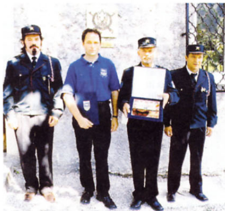
Dobro delo veteranske organizacije ni ostalo skrito in Občina Velike Lašče jim je podelila zlato plaketo.