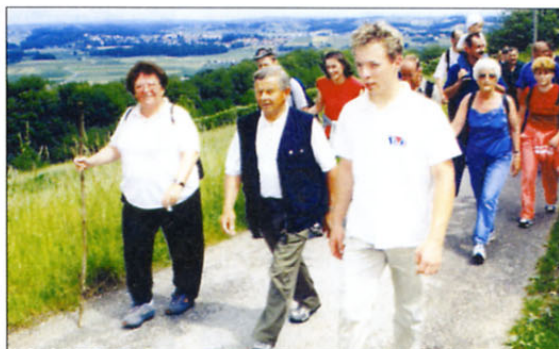
Pohodniki na poti od Voličine do Zavrha.