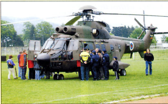
Kjerkoli se je v minulih nekaj mesecih pojavil, je cougar vzbujal pozornost mladih in starih.

Razlikujejo se tudi med seboj. V sestavi 15. brigade vojaškega letalstva so štirje cougarji, ki se med seboj razlikujejo le v podrobnostih: dva sta opremljena s hidravličnim dvigalom, dodatnim