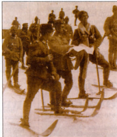
Skupina turških vojakov na smučeh med patroliranjem na bojišču na Kavkazu. Zanimivo je, da ima vsak vojak le eno smučarsko palico.

gotovo neresnična trditev, da so ujeli rusko ladjo, ki je skušala minirati vhod v Bospor. Dne 2. novembra je Rusija napovedala vojno Otomanskemu cesarstvu, tri dni pozneje pa sta ji sledili še Britanija in Francija. Še pred tem so britanske ladje potopile polagalca min v zalivu Izmir in obstreljevale Akabo v Rdečem morju. Obstreljevanje dardanelških trdnjav angleško-francoske flote 3. novembra je samo potrdilo, da je Otomansko cesarstvo v vojni s tremi največjimi evropskimi imperiji. Na turško-nemški konferenci 1. avgusta so predlagali, da Otomansko cesarstvo zavzame izključno obramben položaj proti Rusom in pridobi morskno prevlado v Črnem morju. Vsi ti načrti pa so bili le akademski, dokler se ni vedelo, kakšni vlogi bosta v vojni igrali