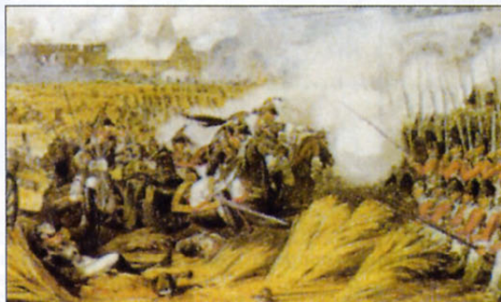
Bitka pri Waterlooju: tako jo je videl neki slikar.

Razlogov za obisk tega muzeja je torej veliko, vendar vam bi tokrat radi predstavili drug muzej, ki je prav tako povezan z vojsko in vojnam. Po svoje je morda celo bolj zanimiv, toda dejstvo je, da je veliko manj znan kot British Imperial War Museum.