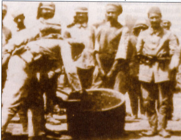
Turška vojaška kuhinja nekeje v zaledju fronte na Galipoliju. Brez dvoma gre za arabsko enoto, eno izmed tistih, ki so odigrale odločilno vlogo pri turški zmagi na tem bojišču. Velika posoda je zelo podobna tistim, ki so jih uporabljali janičarji vso svojo zgodovino in zgodovino otomanskega imperija.

Turčija kakor mož, ki so ga v gozdu napadli tatovi. Tak človek, je rekel, bi se z veseljem odrekel denarju, blagu in celo obleki, da bi lahko obdržal življenje in morda majico. Slabe tri mesece