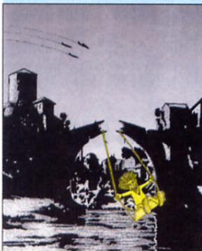
»Kaj pa otrok ve, kaj je vojna!«