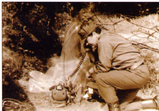
Nad vse pomemben prispevek k naši zmagi so dali pripadniki enot za zveze, saj so omogočili dobro poveljevanje in hitro povezavo med enotami in štabi.

napada. Tudi mi se umaknemo globlje v gozd. Pogledujemo proti nebu, stiskamo puške in pripravljene smo tudi streljati,