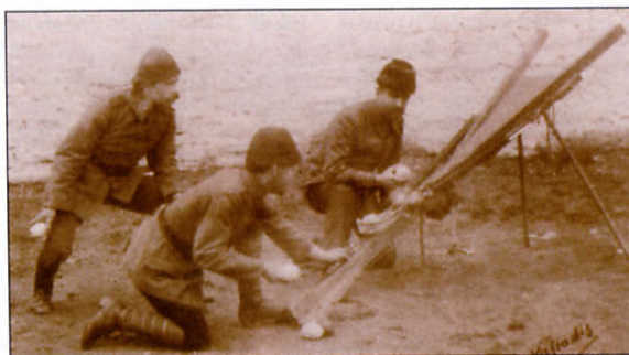
Podčastniki turške vojske se urijo na lesenem katapultu za metanje ročnih bomb.

V letih 1908-09 so vojaški častniki z revolucijo odstavili zadnjega absolutnega vladarja Otomanskega cesarstva sultana Abdulhamida II. Čeprav so sultani ostali na prestolu še 14 let, je prava oblast pripadala t. i. »mladoturkom«. Vladavina je bila v rokah triumvirata, ki so ga sestavljali notranji minister Talat Paša, vojni minister in načelnik generalštaba Enver Paša ter minister za pomorstvo Ahmet Kemal Paša in ki je kmalu začel vladati diktatorsko. Revolucija mladoturkov je sprožila obdobje nasilnega prevrata in hkrati so na vseh področjih življenja turške države izpeljali reforme. Te so komaj začeli, ko je cesarstvo v Libiji napadla Italija. Sledili sta še balkanski vojni. Do leta 1914 je država izgubila skoraj vsa evropska ozemlja, ostale so ji Anatolija in arabske province. V teh vojnah je bilo pobitih veliko evropskih muslimanov, poleg tega je moralo cesarstvo, ki se je skrčilo, sprejeti še veliko beguncev, ki so bežali pred etničnim čiščenjem z ozemelj, ki so jih zasedli Grki, Srbi, Črnogorci in Bolgari. V teh črnih letih je nova »nacionalistična« ideologija pritegnila veliko privrženec med večinskim turškim prebivalstvom v cesarstvu. Takoj po katastrofalnih balkanskih vojnah je otomanska vlada za pomoč prosila Veliko Britanijo, Francijo in Rusijo. Te so jo zavrnilo, zato so se morali mla-