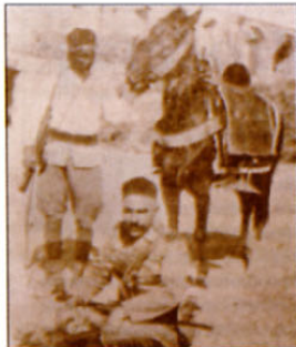
Turški častnik in njegov afriški sluga. Posnetek je nastal leta 1918 v Libiji. K onjska oprema je tipična za severno Afriko oziroma Libijo.