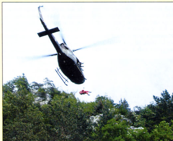
Helikopterji cougar in starejši bell 412 (na posnetku je eden od njih na skupni vaji s člani Gorske reševalne službe) bodo v prihodnosti predstavljali tandem, ki bo prispeval k še bolj uspešnemu delu sil zaščite, reševanja in pomoči.