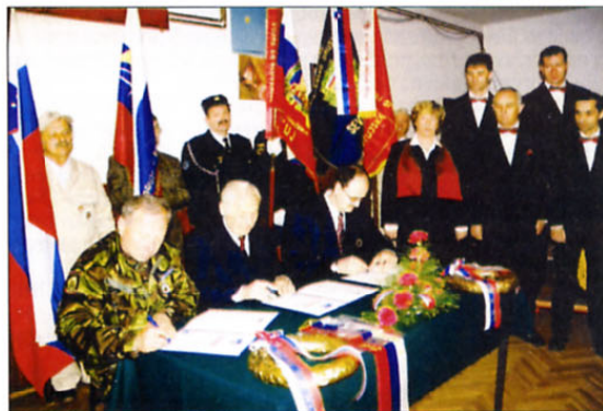
Predstavniki veteranskih organizacij s Ptuja podpisujejo listino o medsebojnem sodelovanju.