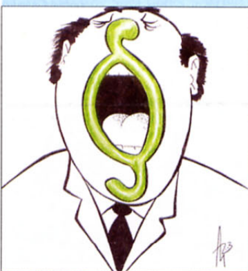
(Veteranski) zakon »lačni Franc«