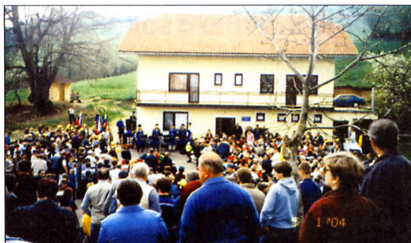
Srečanje na Planini je bilo posvečeno kar trem dogodkom: dnevu OF 27. aprila, prazniku dela 1. maja in vstopu v EU.

hkrati pa pomaga krepiti novo oblikovane demokratične družbe. Pri raznih dvomih pomislimo na globalizacijo, terorizem, varnost, razne osamitve, obveznosti do okolja, predvsem pa na naše možnosti. Na razvoj, izobraževanje, sprejmemo nove izzive, pred nami so razni evropski skladi, ki jih že črpamo, izkoristimo jih. Pomislimo tudi na naše mlade, niso tako vezani na naša ognjišča kot mi, željni znanja in življenja imajo s tem vstopom nove možnosti in priložnosti. Ne pozabimo na delavce, socialno ogrožene, poiščimo priložnosti tudi za njih.