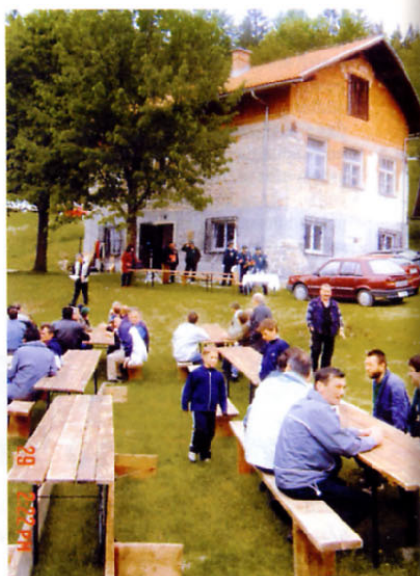
Nekdanja Osnovna šola v Krvavi Peči postaja središče delovanja veteranov iz Velikih Lašč in okolice.