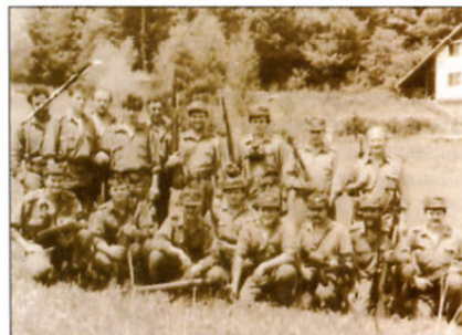
Spominski posnetek iz vojne. V mnogih srcih naj bi ostala zapisana kot nekaj, kar se ne bi smelo več nikoli ponoviti.