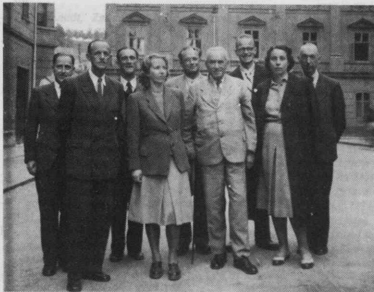
Delavci Mestnega arhiva konec maja 1952