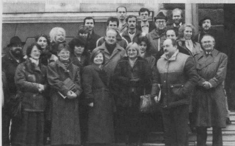
Delavci Zgodovinskega arhiva Ljubljana decembra 1987

Stanje začasnih skladišč po občinah se je začelo v zadnjem času občutno slabšati, največ zaradi vlage. Predvsem odročnost skladišč po občinah močno otežkoča uporabo, ki je še nadalje v porastu. Koncentracija gradiva na sedežih enot bi bila gotovo smotrna. V Ljubljani, kjer arhiv že drugo desetletje ni mogel prevzemati arhivskega gradiva, ker so bile vse skladiščne kapacitete zasedene, se je našla (vsaj za daljši čas) leta 1981 rešitev v zvezi s prenosom sosednje zgradbe Ciril-Metodov trg 21. Tu je začel arhiv pridobivati dodatne prostore, v bistvu pa gre za idejo, ki jo je imel arhiv že od leta 1958 dalje. V letih 1980 do 1982