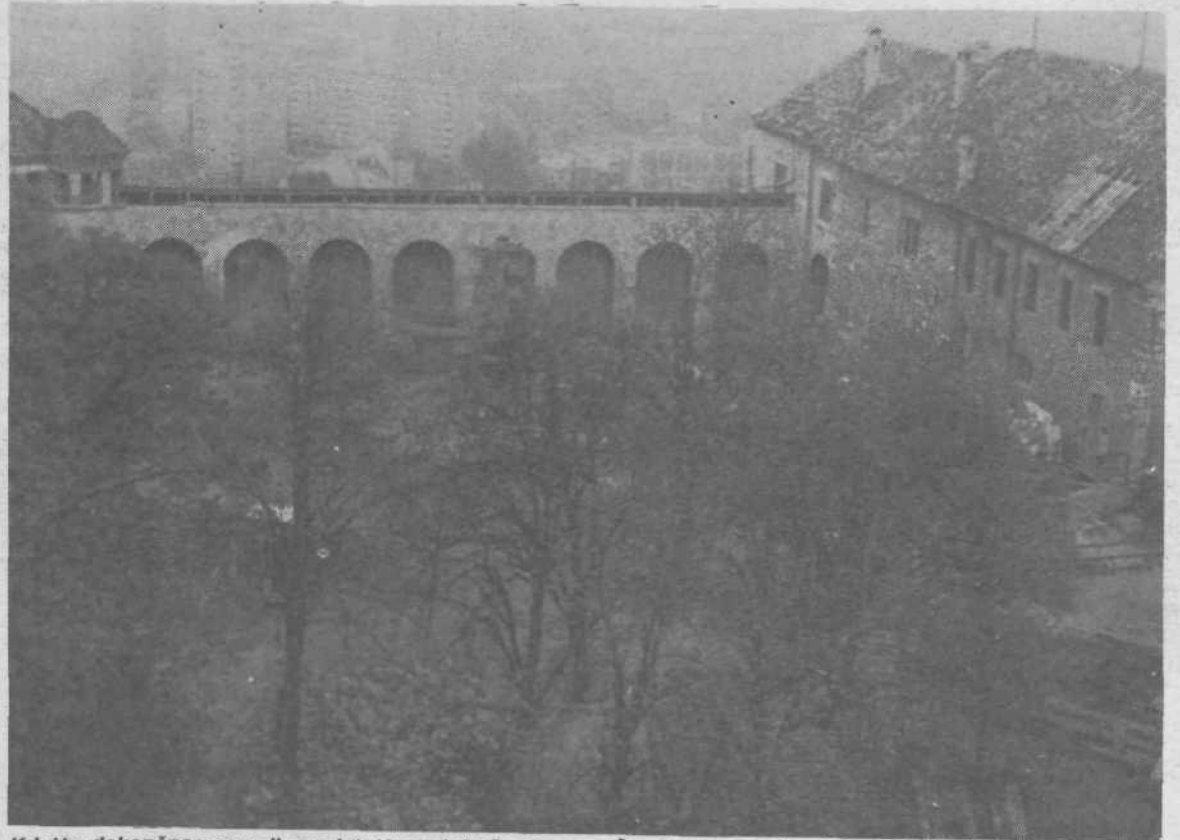
Kdaj bo dokončno prenovljen celotni kompleks še ni znano. Čas dograditve je odvisen predvsem od bodočih lastnikov lokalov, ki bodo na gradu. Znano pa je, da bodo prvi bife odprli že v začetku prihodnjega leta.