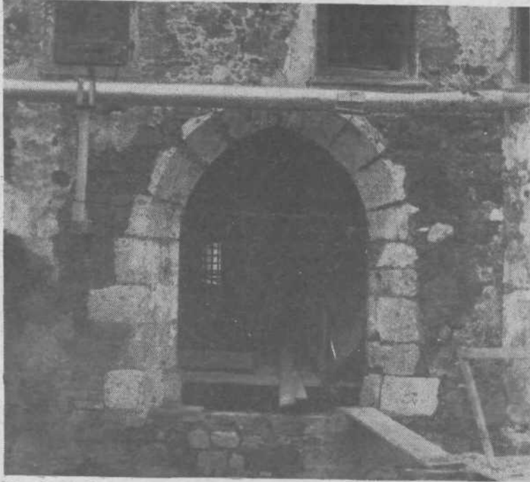
Zgrajen je že popolnoma nov vhod na grajsko dvorišče, ki bo namenjen predvsem za lokalni dovoz. Cev, ki jo vidite na sliki nad vhodom, je del novega vodovoda.

Skorajda ni dneva, da se na ljubljanskem kamnitem »starcu« ne bi zgodilo kaj novega. Prenovitevna dela so zajela domala že sleherni kotiček gradu. Finalizacijska dela so že končana.