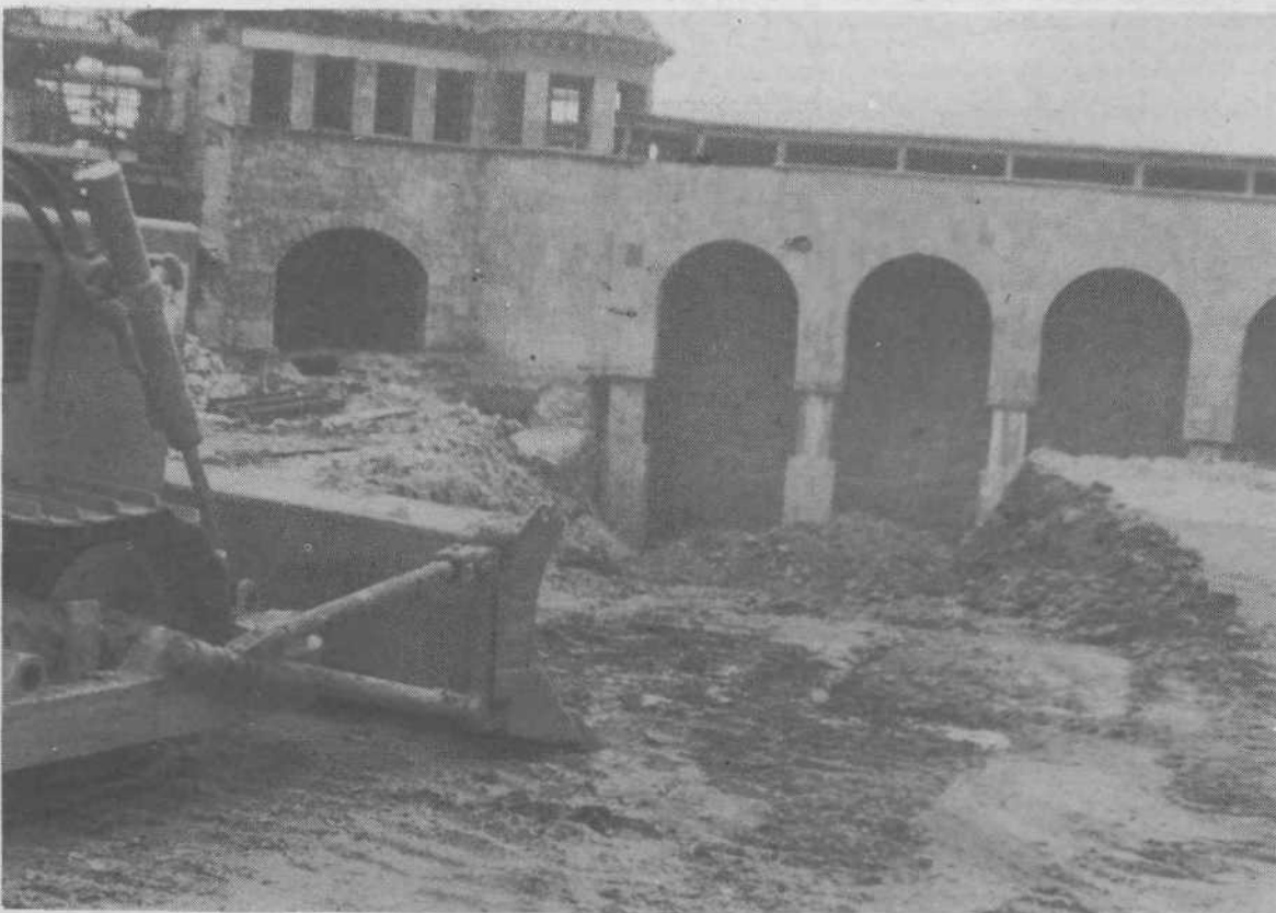
Novo obliko ima tudi severni del. Na levi strani bodo obnovili kletne prostore.