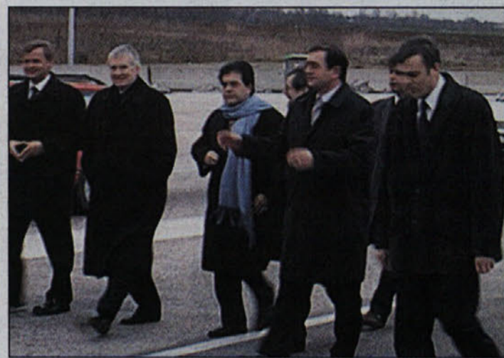
Delegacija ob ogledu MPMP Obrežje

problematiki ilegalnih migracij in vzpostavljanju schengenskih standardov. Pri tem sta notranja ministra Italije in Nemčije Sloveniji izrazila svojo podporo in pomoč. Slovenija je namreč po mnenju sogovornikov na do-