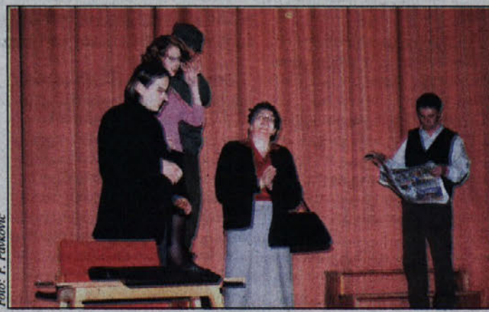
Člani gledališke skupine med nastopom