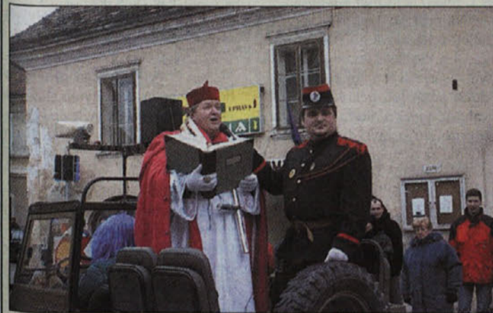
Na povorki, ki se jevila po Kostanjevici, so oklicali Kurenta. Po tradiciji je to delo opravljal kanonik z dvajsetletnimi izkušnjami.

V Dvorcu Impoljca so pustni ples priredili na prvo marčevsko soboto, med drugimi so ga zaznamovale tudi tamkajšnje čarovnice.