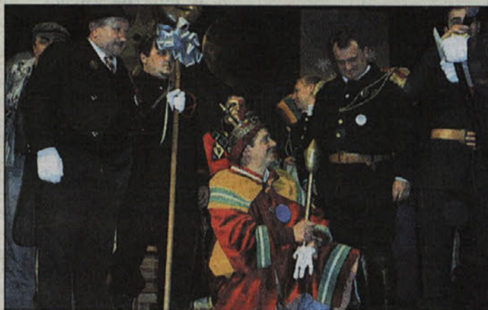
Občni zbor Prforcenhaus je prinesel tudi novega predsednika, ki se je dal takole okronati. Začuda se tudi ni veliko branil.

Že stoletje in pol v času pusta odzvanjajo te besede po Kostanjevici. In letos je bilo tudi tako. Najprej je oblast prevzel Prforcenhaus, nato je sledila povorka z oznanjevanjem Kurenta. Na občnem zboru so dobili novega predsednika Prforcenhaus, potem pa so se od svojega Kurenta Cvička Matička dostojno poslovili. Spominjali so se ga na veseli sedmini.