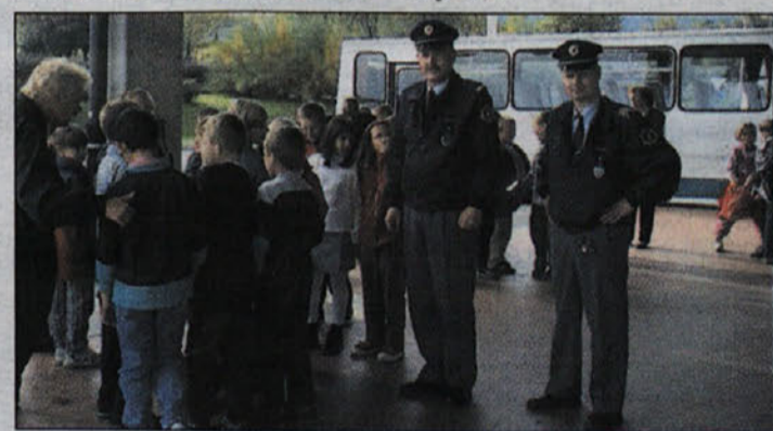
Skupina učencev iz OŠ Bizeljsko

Polet bo tudi res izveden, obljublja organizatorji učne ure, in sicer aprila ali maja, odvisno od vremenskih pogojev in zasedenosti helikopterja. S.V.