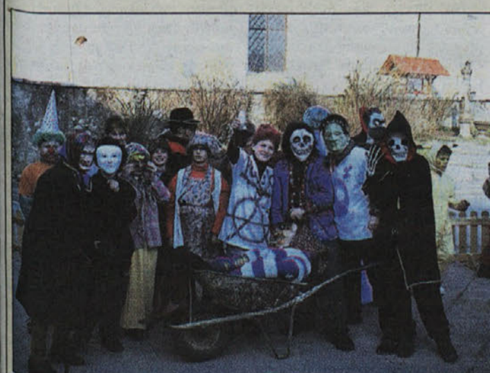
Na Raki so pustovali na trgu. Takole so se pred naš objektiv postavili tamkajšnji šolarji, ki so rajali z ansamblom Kresničke.