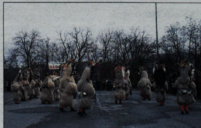
Množica je v Dobovi občudovala spretnosti kurentov, ki so plesali na prireditvenem prostoru.

O tem, kaj se je dogajalo in kako je bilo tudi drugod, pa smo podrobneje zabeležili