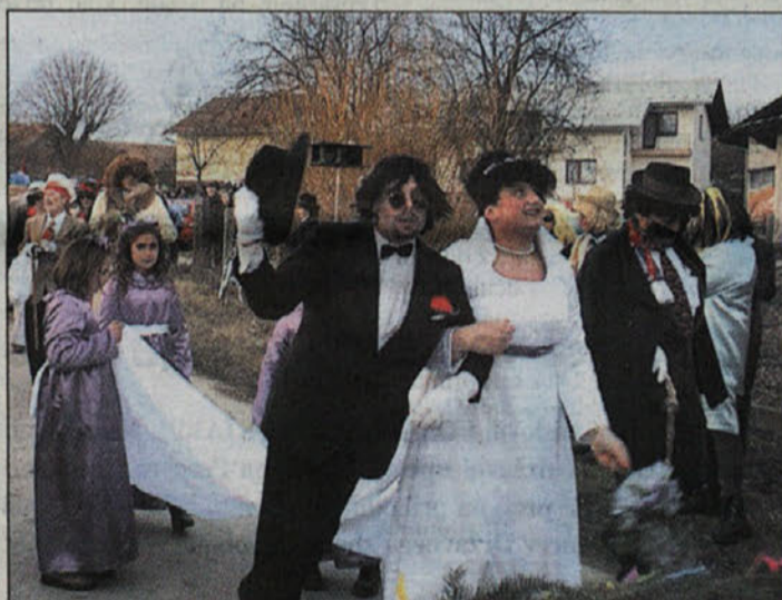
Nori kravič je bil šibak in bolehen, Muka je postala še iste noči vesela vdova, ljudje pa v jok. Poskrbeli so za dostojno slovo.

Nori kravič je počival v mrliški vežici v Ločah. Potem je prišel krematorij, sledila je upepelitev in nora zabava za konec.