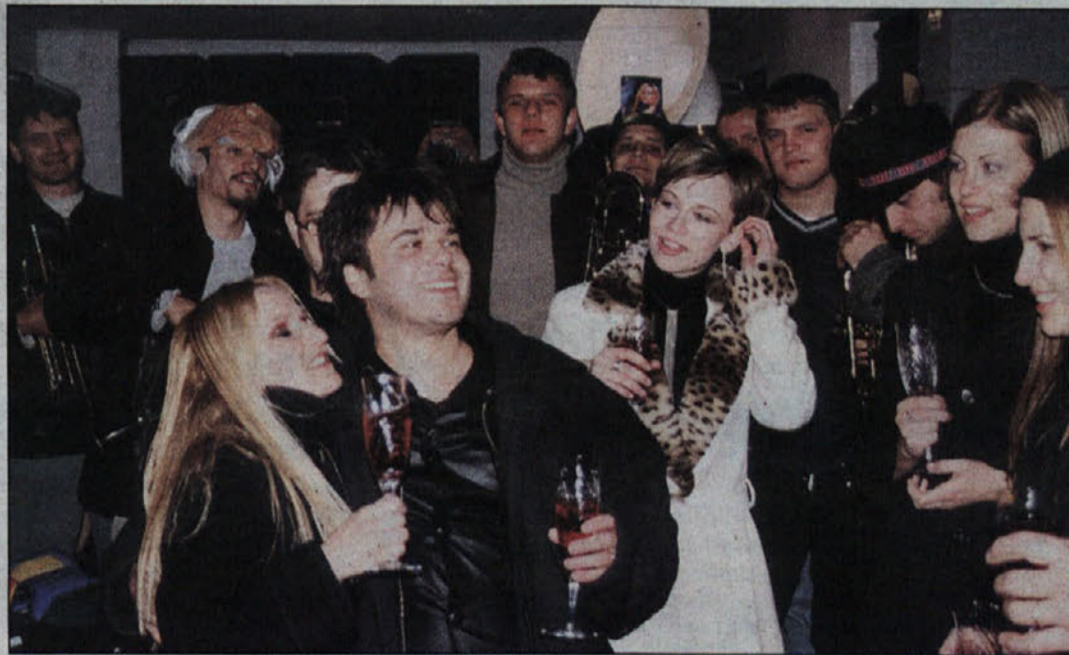
Prve čestitke domačinov