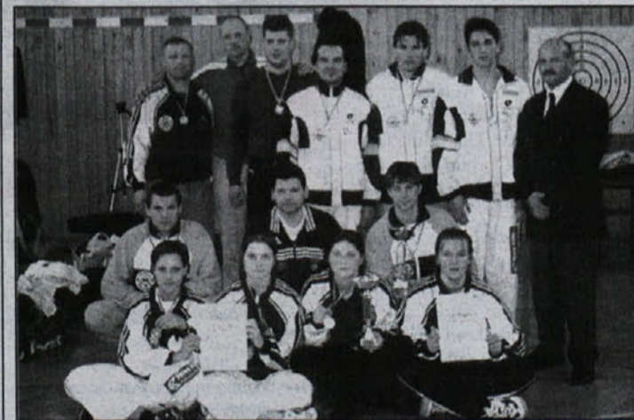
Zlata dekleta v družbi srebrnih fantov, trenerjev, fizioterapevta in predsednika društva

Ljubljana - Pokala Slovenije v ekipnih ju-jitsu borbah so se med šestimi slovenskimi klubi udeležili tudi tekmovalci Društva borilnih veščin Katana Ten team Globoko. Dekleta so bila nepremagljiva, moške pa so ugnali le Celjani, skupno so v borbah dosegli doslej najboljši uspeh.