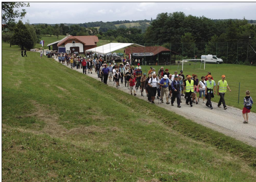
Odhod iz Búdinec

Po pozdravni rečaj Vendela Židoja, steri je ejkstra gučo o tom, ka paut pela po tistom tali med Búdinci pa Andovci, gde je gnauksvejta bijo gorazorani mejni pas (határsáv), kama je nej smejla človeška nauga, smo