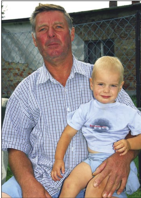
Laci, če ma čas, se najraj špila z vnukom

biu, pa od njega sem daubo volau. Gda sem zgotauvo, te sem v Somboteli pri Voláni (avtobusno podjetje) začno delati, dve leti sem se vsakši den vozo ta pa nazaj