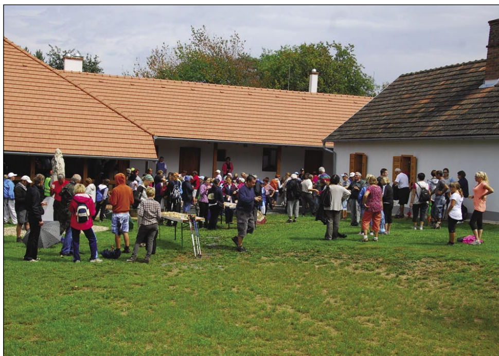
Pri andovskoj domačiji so si pohodniki malo spočinauli

se napautili prejk lejpi búdinski gaušk do nekdenošnje laktanje, gde je zdaj naredjena mala útica, v sterij si leko pohodnik spočiné. Mi smo si tő malo zdenili, spili kakšno vodau, sok ali špricer, poslušali veselo spejvanje ljudski pevk iz Búdinec, stere je sprvajo harmonikaš Djuši. Dapa v momentu je skurok kmica gratala, začno dež šprickati. Iz ruksakov so naprejprišli dežni plašči pa držence (dežniki) pa je drugo nej ostalo, trbelo je titi tadale. Skurok do Andovec nas je prau dež, kak smo se približevali stari domačiji (Malomi Triglavi, Hiši rokodelstva) je dež enjo.