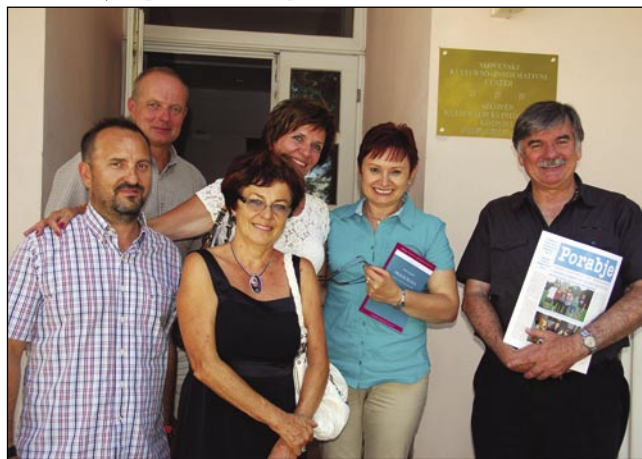
Slovenska delegacija pa vogrski člen društva so bili v našem uredništvu tö