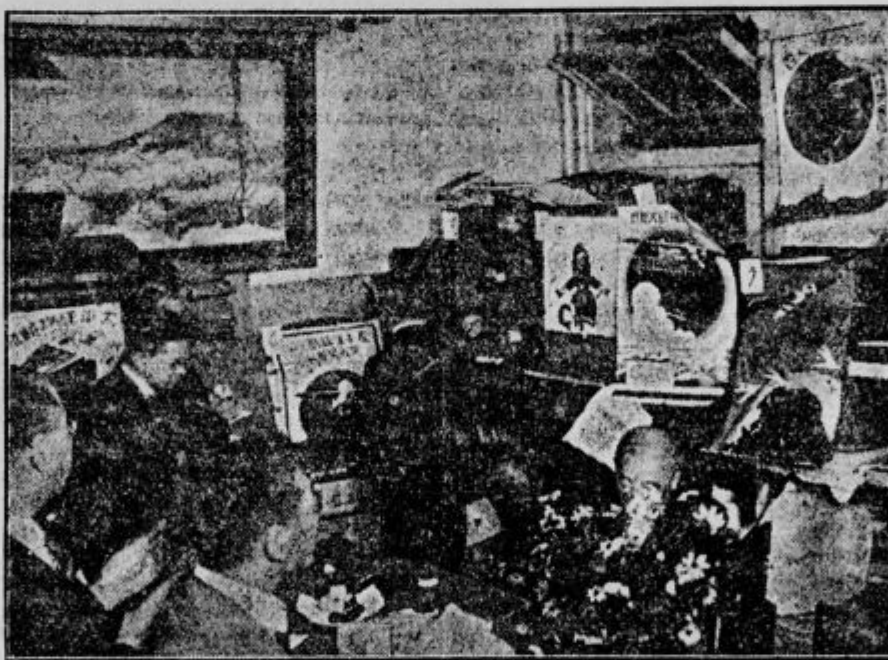
TUDI JAPONCI SE PRIPRAVLJAJO NA POLET PREKO OCEANA.

Blizu Indrije v Slavoniji so kmetje pred dnevi opazili, da živina nikakor noče piti iz vaškega vodnjaka. Naprosili so popravljalca vodnjakov, naj