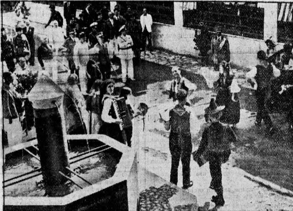
Italijanski kmetje v narodnih nošah plešejo pred kraljem Viktorjem Emanuelom.

Na letališču ravno vzletelo letalo. Na drugi sliki vidimo, kako gori neka avtogaraža. Videti je celo, kako hite ljudje k požaru, da bi ga pogasili. Prav majhni ljudje hite po široki cesti naprej, razna prometna sredstva drve, vsi hiti. Slike iz višine 13.000 m govore o življenju na zemlji.