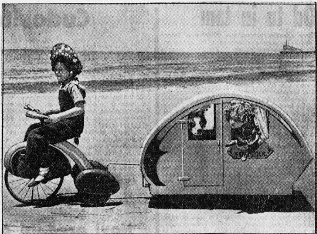
S kalifornijske obale: Devetletno dekletce pelje svojo petletno sestrico z malim »stanovanjskim vozilom« na sprhod ob morju. Zraven spadata seveda tudi kužek in muček.

Tako razlikujemo takoj v začetku dva črkopisa: semitsko-grški in semitsko-grški-rimski. Prvega so sprejeli Kopti, sosedje starih Egiptčanov, potem Rusi, Bolgari in Srbi, drugača ostala Evropa: Spanci, Francozi, Angleži, Nemci in drugi. Da je ta edini in isti črkopis, nam dokazuje isto število črk, njihova imena in pa raztresenost samoglasnikov med soglasniki.