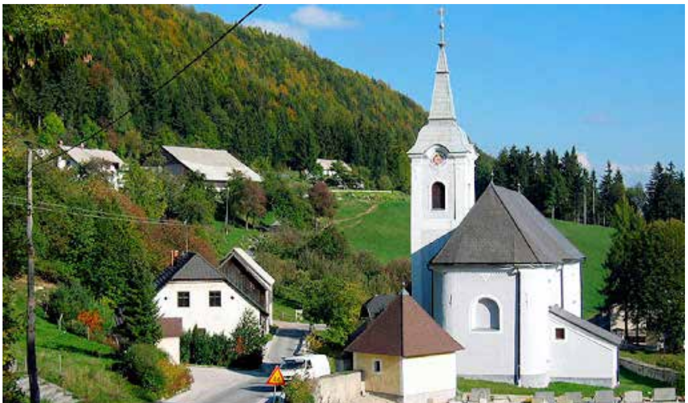
Bele Vode v Velenjskem hribovju

Smrt upokojenega mornariškega kurata. Slovenski gospodar, 7.8. 1935, str. 3.