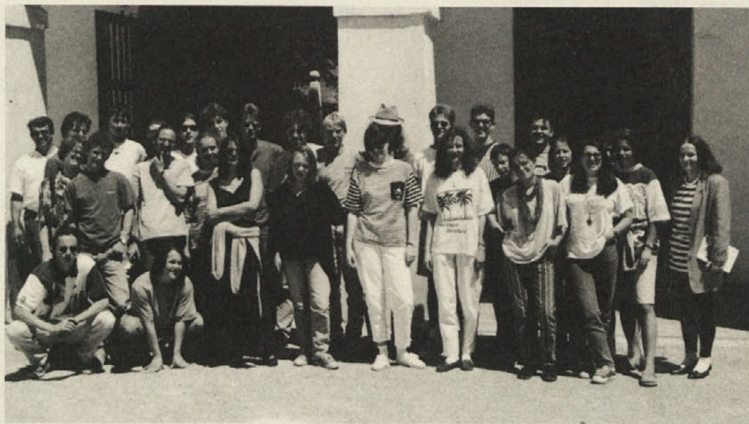
Letošnji maturanti na izletu po Sloveniji