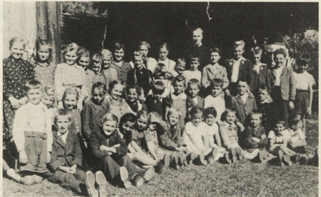
Množica otrok, ki je obiskovala lepensko šolo leta 1948.