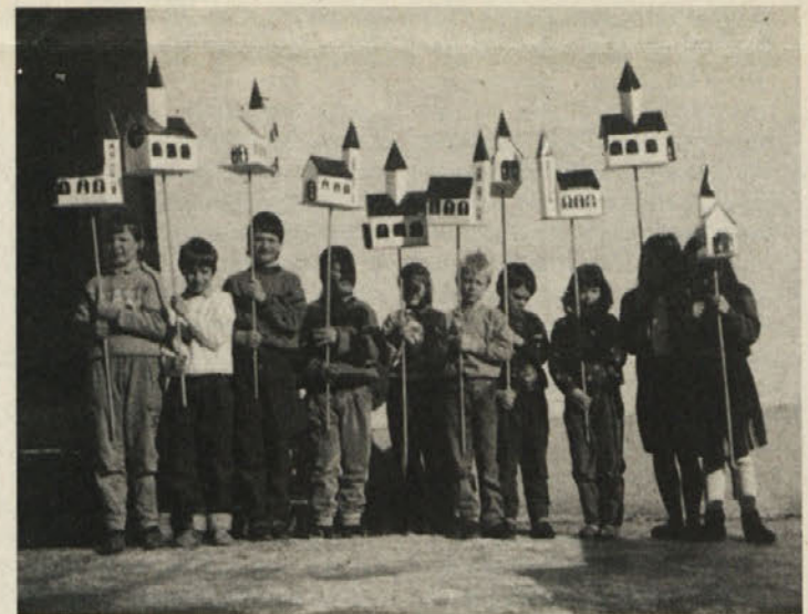
Danes otrok ni več veliko, zato pa so s šolo ravno tako povezani kot njihovi starši.

Nazadnje pa še to: Odkar obstajajo šole, so si učitelji in