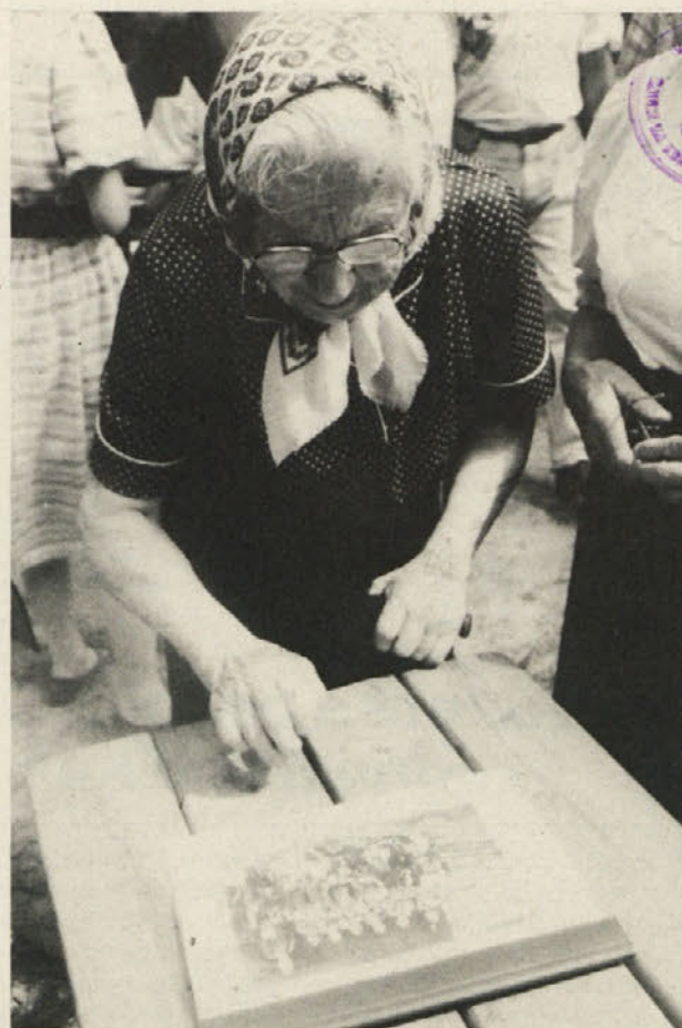
Posebno starejši ljudje so ganjeni obujali spomine na čase, ko so v Lepeni hodili v šolo.