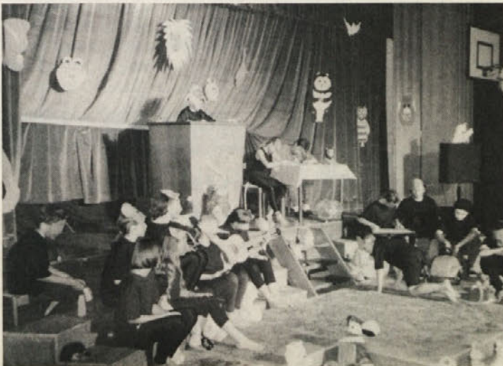
Sodni tribunal živali je potrkal a vest ljudi